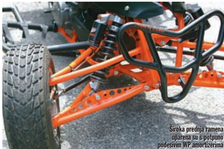
Široka prednja ramena uparena su s potpuno podesivim WP amortizerima