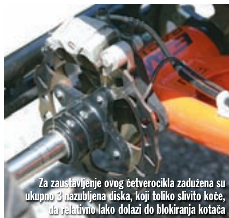
Za zaustavljanje ovog četverocikla zadužena su ukupno 3 nazubljena diska, koji toliko slivito koče, da relativno lako dolazi do blokiranja kotača

Ipak, sve je to cijena koju se isplati platiti ukoliko se usudite izvlačiti