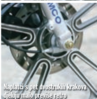
Naplatci s pet dvostrukih krakova djeluju malo previše retro