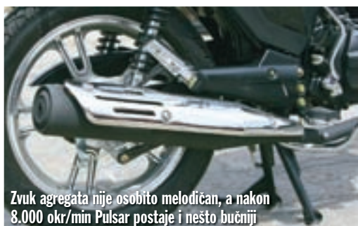
Zvuk agregata nije osobito melodičan, a nakon 8.000 okr/min Pulsar postaje i nešto bučniji

Osim tih vibracija, ocjenu za ukupnu udobnost donekle spušta i izvedba sjedala, koje je toliko mekano da je premekano, odnosno ne može kvalitetno amortizirati udar-