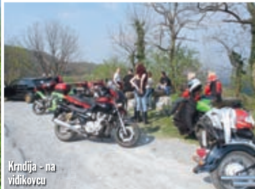
Krndija - na vidikovcu