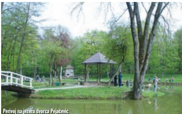
Perivoj na jezeru dvorca Pejačević