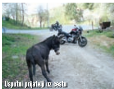
Usputni prijatelji uz cestu

mjesto koje je nedavno slavilo 100. godišnjicu organiziranog bavljenja turizmom. Poznato je po jezeru poviše grada i staroj utvrdi Ružici gradu iz 1357. godine. Odavde počinje uspon zavojitom cestom koja je raj za racere, pa i mi popuštamo pred ovim izazovom i grabimo uzbrdo. Povremeno vas iz ovog divnog sna probudi onaj poznati zvuk kada slajderom na koljenu dotaknete cestu i upozori vas na oprez. Negdje pri vrhu uspona, južno od Orahovice, na obroncima Krndije odvojak je za manastir Sv. Nikole. Ovdje bi nam dobro došao neki off roader, no ipak ne odustajemo nego polako vozimo krivudavom kaldrmom prema manastiru. Na izlazu iz guste šume, na proplanku ispred nas u samom srcu ovog gorja smješten je manastir. Izuzetan je to primjer sakralne