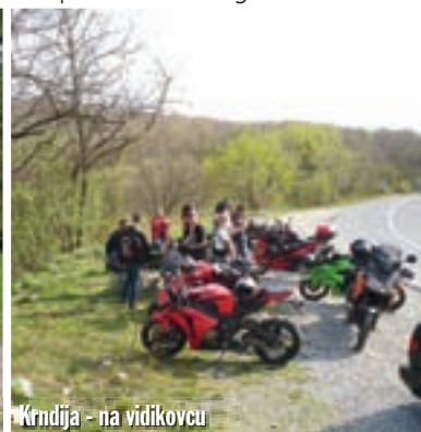
Krndija - na vidikovcu