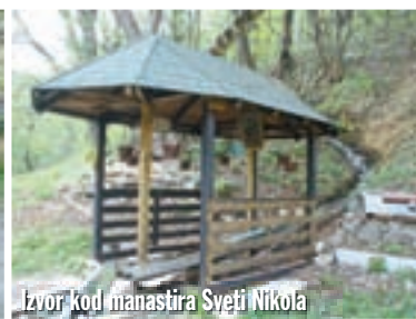
Izvor kod manastira Sveti Nikola