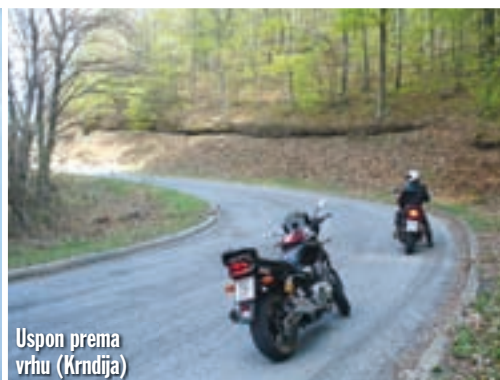
Uspon prema vrhu (Krndija)