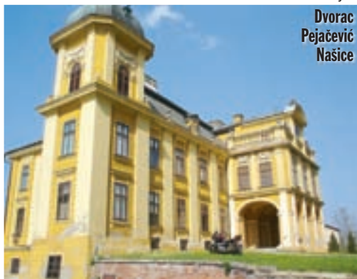
Dvorac Pejačević Našice