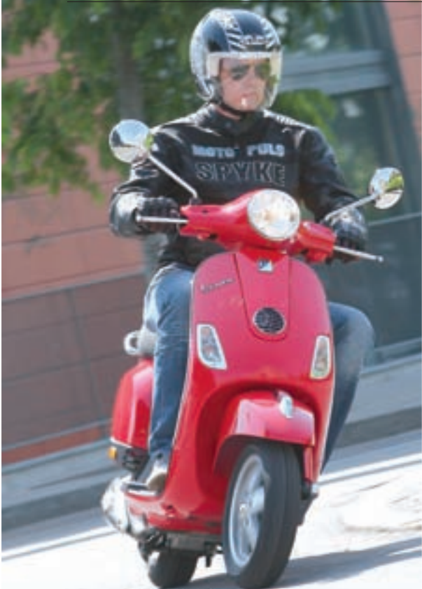
Manja osnova Vespe (LX) pomalo manjka na polju udobnosti, ali je zato okretnost zavidna pa je ovaj skuter moguće provući kroz poslovilnu "ušicu igle" i to sa stilom