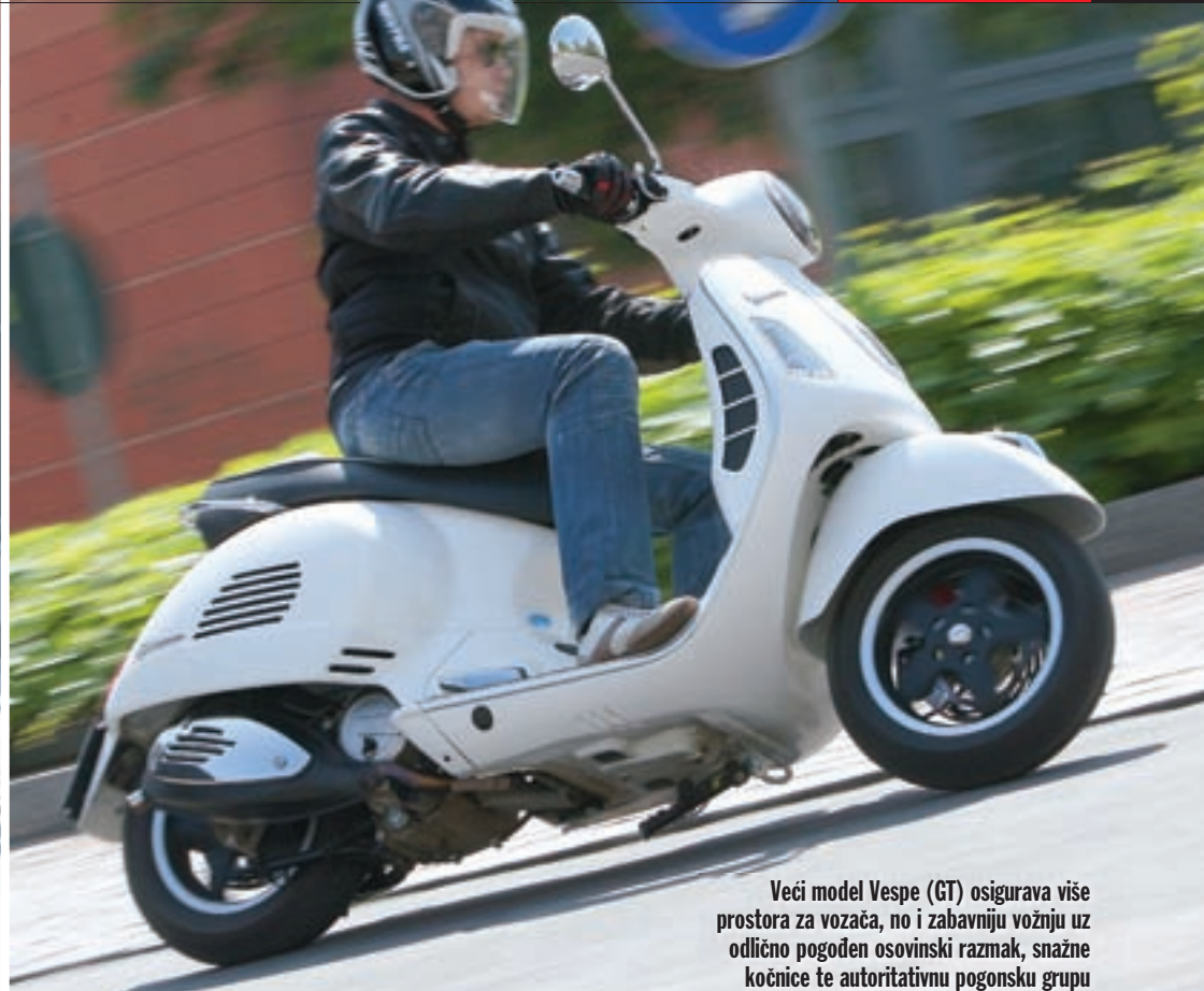
Veći model Vespe (GT) osigurava više prostora za vozača, no i zabavniju vožnju uz odlično pogodan osovinski razmak, snažne kočnice te autoritativnu pogonsku grupu

udarac. Po pitanu kočenja smo dobili ono što smo očekivali. Iako drugi proizvođači ponekad manje uspješno ugrađuju na svoje modele kombinaciju diska i bubnja kao kočione grupe, na svakom modelu na koji je Piaggio to odlučio učiniti kočnice su više nego adekvatne. Uglavnom, Vespa LX 4T4V predstavlja svijetlu budućnost skutera odjenu u odijelo dugo poznatog kroja, a ugodno je voziti skuter male zapremine s kojim nije problem ravno-pravno sudjelovati u prometu.