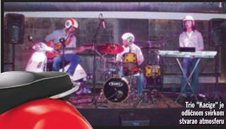
Trio "Kacige" je odličnom svirkom stvarao atmosferu

Talijani su ponosan narod, a pogledamo li neka od njihovih nacionalnih blaga poput Rima, Venecije i Vespe, imaju na što i biti ponosni. Zanimljivo li kravate ili Vegetu - za koje bi bilo pogrešno reći kako u svijetu postoji svijest o tome da potiču iz Hrvatske - mi zapravo i nemamo poznatih, odnosno jakih "brandova". Zamislite samo kako bismo mi bili ponosni da je Vespa hrvatski izum i proizvod. Pa, Talijani su na nju ponosni, a osim što na taj način pomažu njenom uspjehu, na simpatičan način koriste priliku organizirati tematsku proslavu. Dvodnevno slavlje je uključivalo tridesetak testnih motocikala koje je bilo moguće iskusiti u milanskom prometu, s tim da se osim novopredstavljenih modela moglo isprobati i svaki drugi model Vespe u ponudi. U sumrak prvog dana ovog druženja u popularnom milanskom okupljalištu mladih i onih koji se tako osjećaju organizirana je i zabava. Pored ukusne zakuske i djevojaka ukusnog izgleda živom muzikom je "prašio" odličan trio, prigodno nazvan "The Helmets" (Kacige). Za predstavnike sedme sile (nas novinare) istu večer je u hotelu priređena i kasna večera, ali nismo smjeli pretjerivati s druženjem, jer idući dan smo opet trebali sjesti na Vespe te poput riba u vodi uživati u Milanu. Talijani su primjereno proslavili Vespu, na koju su opravdano ponosni, pa nam nakon svega ostaje jedino poželjeti pozivnicu za Vespa Days i iduće godine. ■