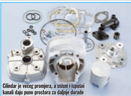
Cilindar je većeg promjera, a usisni i ispušni kanali daju puno prostora za daljnje dorade