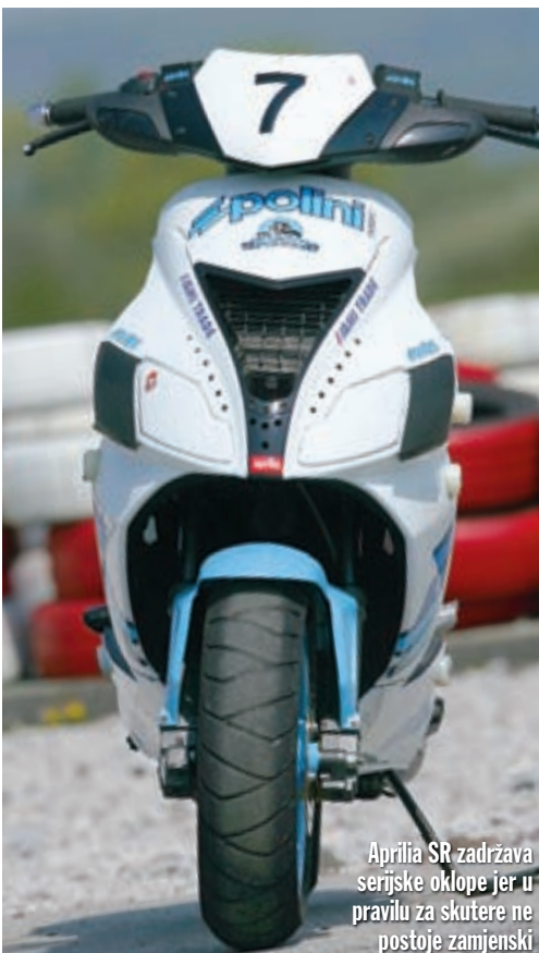
Aprilia SR zadržava serijske oklope jer u pravilu za skutere ne postoje zamjenski

70, u serijske blokove agregata su ugrađeni Polini Evolution 1 radilica i Evolution cilindar, što je rezultiralo porastom zapremine. Da bi sve ostalo na okupu pod povećanim opterećenjima ugrađeni su Polini Evolution ležaji radilice, a ako ne naznačimo drugačije, znajte da su i naredni dijelovi iz iste serije. Na usisnoj strani agregata nalazi se natjecateljski filter zraka, kroz koji udiše rasplinjač promjera 19 milimetara. Da bi se dragocjena goriva smjesa što lakše probila do cilindra tu je usisna grana pod 45 stupnjeva, a natjecateljske usisne lamele se brinu da smjesa u cilindru i ostane. Nakon usisavanja ćemo spomenuti da "struja", dakle stator, rotor, CDI i bobina također nose pot-