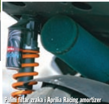
Polini filter zraka i Aprilia Racing amortizer