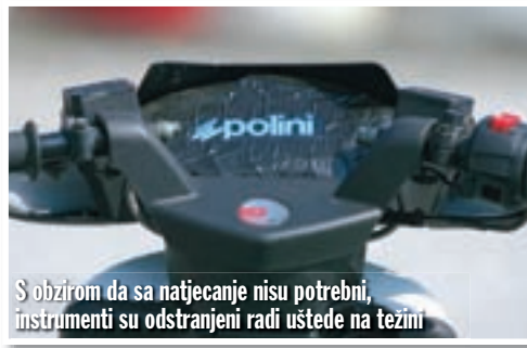
S obzirom da sa natjecanje nisu potrebni, instrumenti su odstranjeni radi uštede na težini