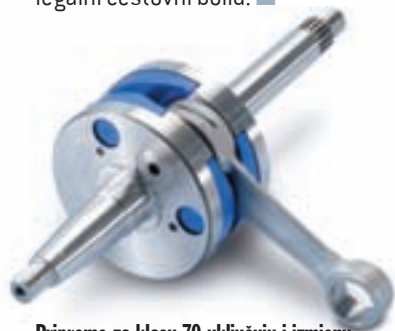
Pripreme za klasu 70 uključuju i izmjenu radilice s pripadajućim ležajima

Kada ne bi bilo van zakona, ovakve prerade bi i skuter namjenjen cesti učinile zabavnim