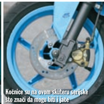
Kočnice su na ovom skuteru serijske što znači da mogu biti i jače