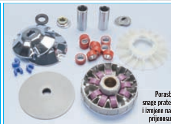
Porast snage prate i izmjene na prijenosu