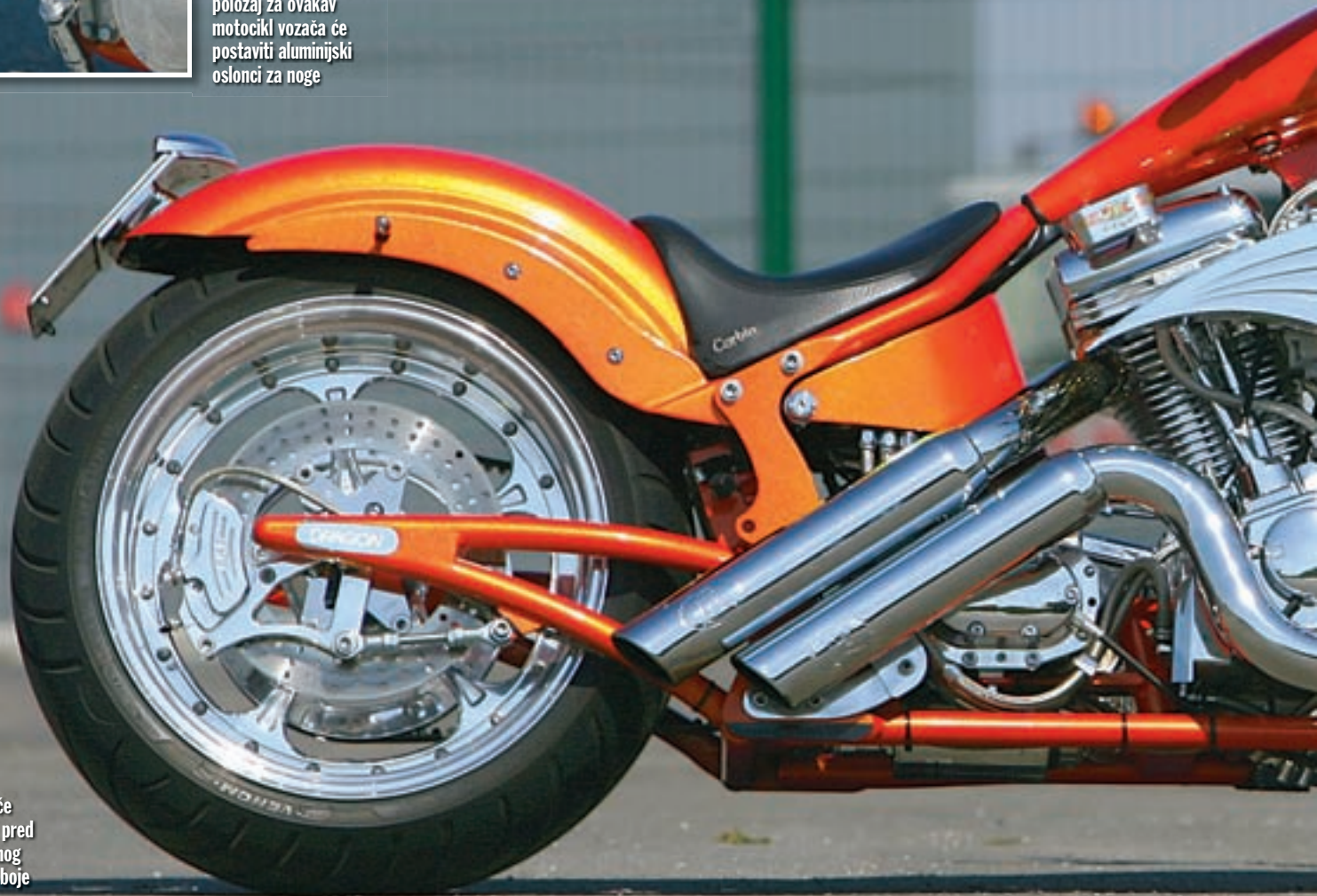
Malo promatrača će ostati ravnodušno pred kombinacijom sjajnog aluminija, kroma i boje s efektom

◀ U prilično umjeren položaj za ovakav motocikl vozača će postaviti aluminijski oslonci za noge