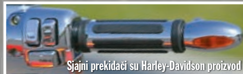
Sjajni prekidači su Harley-Davidson proizvod