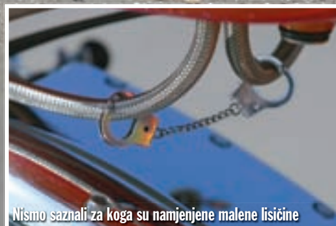
Nismo saznali za koga su namjenjene malene lisičine