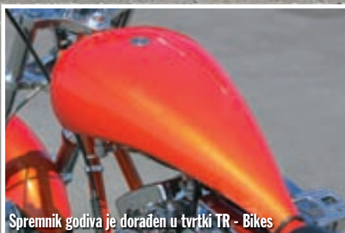
Spremnik godiva je doraden u tvrtki TR - Bikes