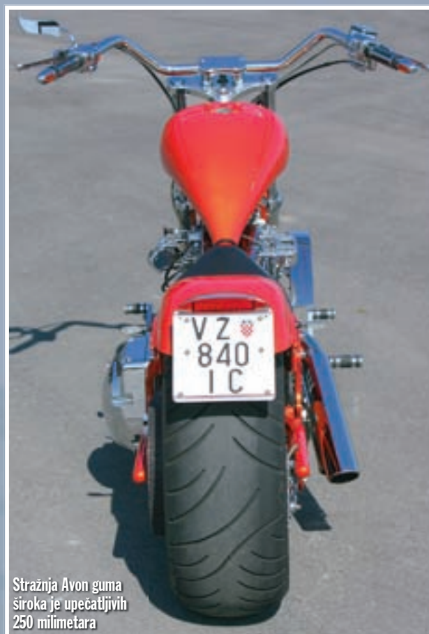
Stražnja Avon guma široka je upečatljivih 250 milimetara

Ako je to iznos o kojem trenutno ne možete niti sanjati, preostaje vam uživati u fotografijama varaždinskog Zmaja. ■