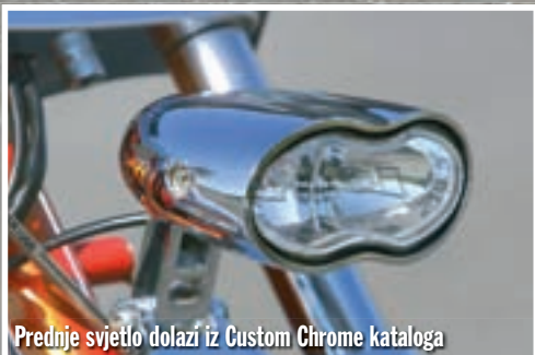
Prednje svjetlo dolazi iz Custom Chrome kataloga