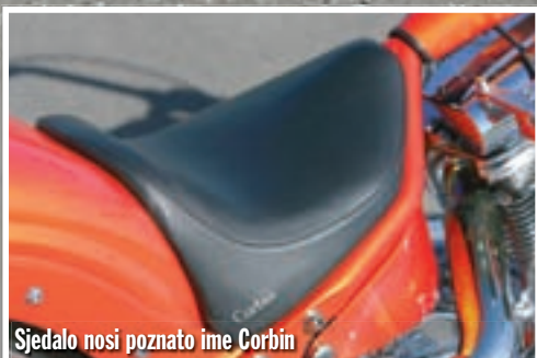
Sjedalo nosi poznato ime Corbin