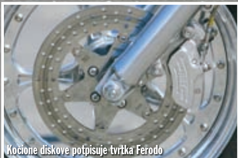
Kočione diskove potpisuje tvrtka Ferodo