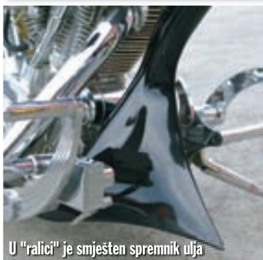
U "ralici" je smješten spremnik ulja