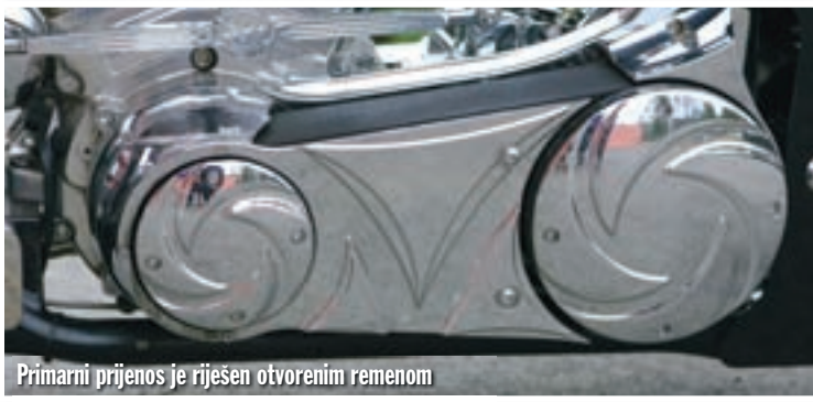
Primarni prijenos je riješen otvorenim remenom

zapremina, koje se ne bi posramila niti većina kombi vozila, bez posebne muke oslobada 162 konjske snage i to uz pomoć jednostavnog S&S Super G rasplinjača ogromnog promjera. Kako prilikom prolaska pored vrtića