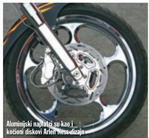
Aluminijски naplatci su kao i kočioni diskovi Arlen Ness dizajn

Odat ćemo vam i jednu tajnu: Ako o ovom motociklu želite raspravljati s prijateljima u omiljenom okupljaštu motociklista i istomišljenika, ne morate sami izmišljati ime jer njegovi tvorcii ga od milja zovu "Požeški Monstrum". ■