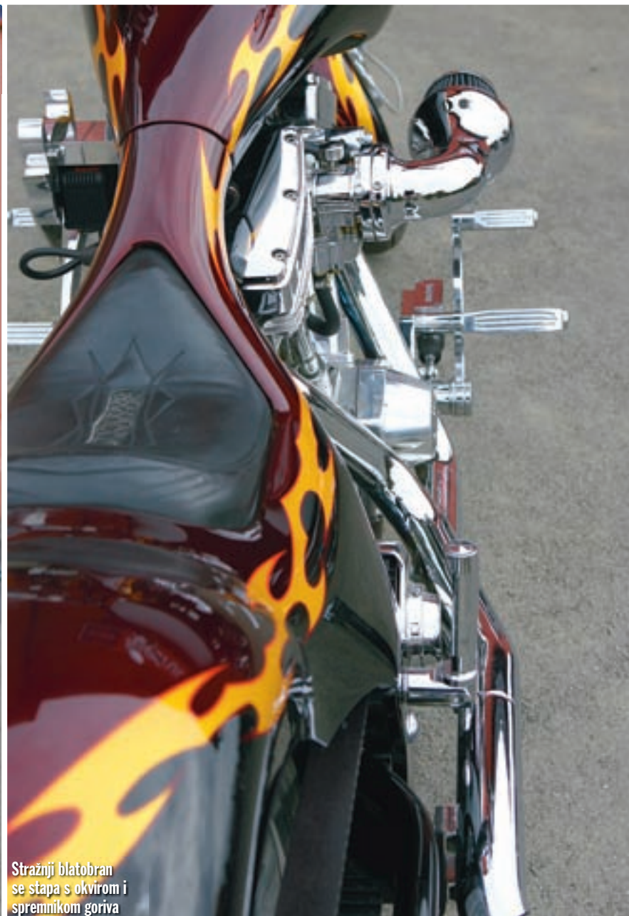
Stražnji blatobran se stapa s okvirom i spremnikom goriva