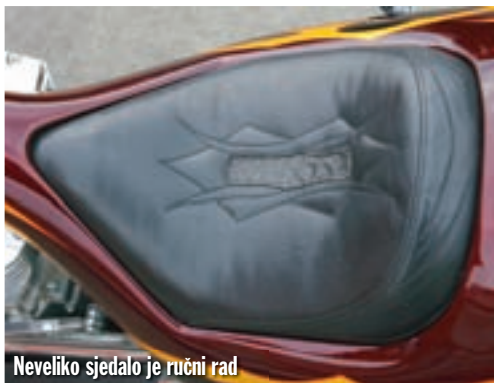
Neveliko sjedalo je ručni rad