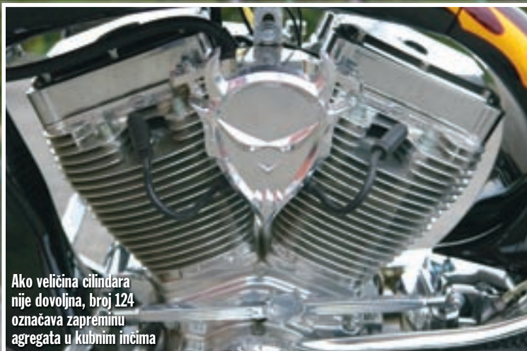
Ako veličina cilindara nije dovoljna, broj 124 označava zapreminu agregata u kubnim inčima