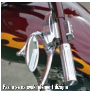
Pazilo se na svaki element dizajna