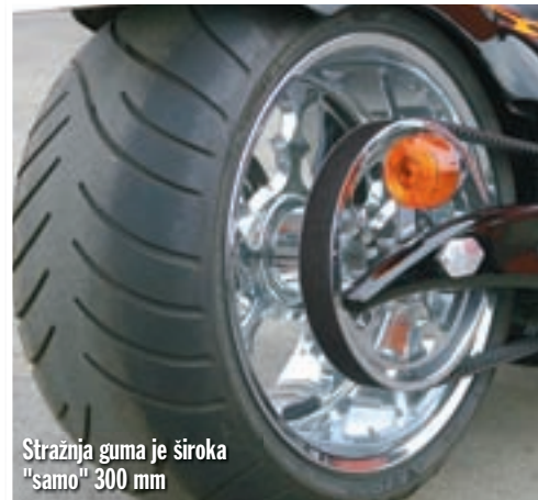
Stražnja guma je široka "samo" 300 mm

kombinaciju boja, koja naglašava posebnost ovog bezimenog motocikla. Ispod nekoliko slojeva prozirnog laka koji daje duboki sjaj nalaze se crna i tamno crvena boja s bogatim perla efektom, a razdvaja ih linija upadljivih "vatrica" plemenskog dizajna. I to je - kao i ostali elementi jedinstveni za ovaj motocikl - djelo tvrtke El Toro Motorcycles.