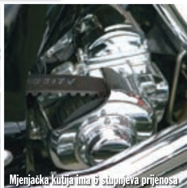
Mjenjačka kutija ima 6 stupnjeva prijenosa