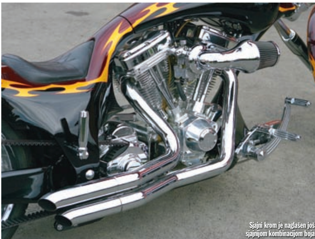
Sjajni krom je naglašen još sjajnijom kombinacijom boja

da njihovi sjajni aluminijски proizvodi nisu lijepi. Oku skrivena elektronika, koja je neizostavna za pravilan rad velikog agregata, također dolazi iz zemlje s crnim predsjednikom i nosi logo tvrtke Dacota Digital. Stražnji ovjes možemo opisati kao softail, jer su amortizeri "pospremljeni" ispod mjenjača, a vilica je - poput okvira - proizvod Rucker Performance. Ostaje nam još opisati sve dijelove koji ovaj motocikl čine istinskim unikatnom. Za početak je tu upravljač, koji zajedno sa već spomenutim nožnim komandama