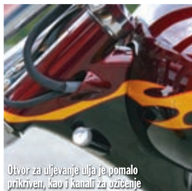
Otvor za ulijevanje ulja je pomalo prikriven, kao i kanali za ožičenje