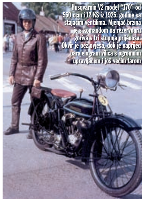
Husqvarnin V2 model "170" od 550 ccm i 12 KS iz 1925. godine sa stajajćim ventilima. Mjenjač brzina je s komandom na rezervoaru goriva s tri stupnja prijenosa. Okvir je bez ovjesa, dok je naprijed paralelogram vilica s ogromnim upravljačem i još većim farom

1919. prvi kompletno proizveden motocikl u matičnoj kući bio je model "150", dvocilindrični model s V motorom uzdužno postavljenim u okviru motocikla. Kut između zraka hladnih cilindara od 50 stupnjeva, 550 ccm zapremine i stajajući ventil podsjecali su na Indiane ili