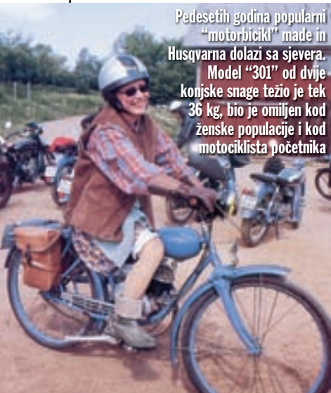
Pedesetih godina popularni "motorbicikl" made in Husqvarna dolazi sa sjevera. Model "301" od dvije konjske snage težio je tek 36 kg, bio je omiljen kod ženske populacije i kod motociklista početnika