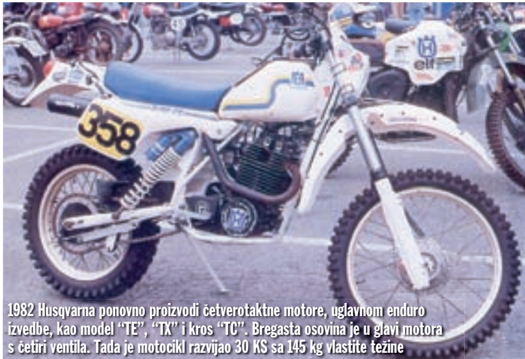
1982 Husqvarna ponovno proizvodi četverotaktne motore, uglavnom enduro izvedbe, kao model "TE", "TX" i kros "TC". Bregasta osovina je u glavi motora s četiri ventila. Tada je motocikl razvijao 30 KS sa 145 kg vlastite težine

Iako ovu tvrtku često povezujemo s motokrosom i endurom, njena povijest mnogo je bogatija. Ni u kom slučaju niste u pravu ako ste i na tren pomislili da je Husqvarna neka "brzopotezna, novokomponirana" tvrtka. Ova poznata švedska moto kuća starija je od stotinu godina