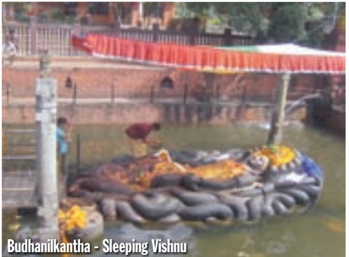
Budhanilkantha - Sleeping Vishnu