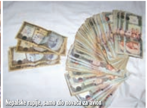
Nepalske rupije, samo dio novaca za avion