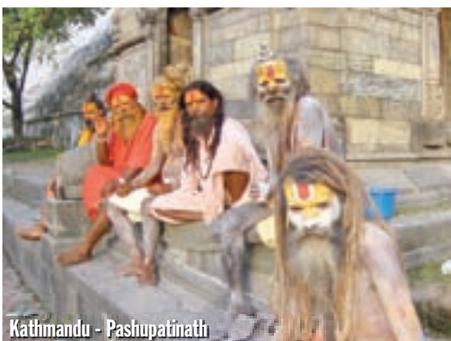
Kathmandu - Pashupatinathi