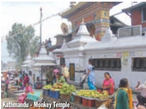
Kathmandu - Monkey Temple