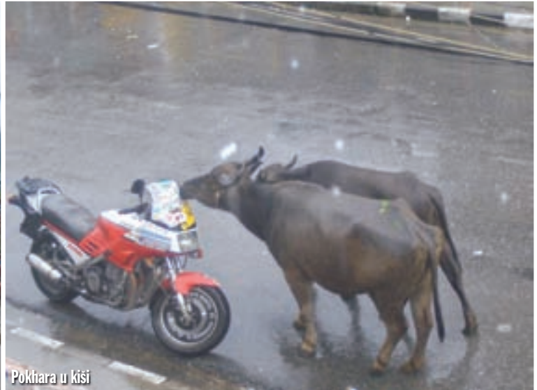
Pokhara u kiši

ce, u pravcu sjevera, otvorio se pogled na bijele vrhove Annapurne, iza njih plavi se nebo. Fantastično! Najviši vrh je i najostriji i svaka čast alpinistima koji se tamo popnu. Otišao sam do jezera, sjeo u čamac, te su me odvezli do otočića. Annapurna s jezera izgleda još božanstvenije, bijeli vrhovi se zrcale u danas plavoj vodi. A i sve drugo izgleda drugačije, ta kombinacija bjeline, plavetnila i zelene vegetacije, taj pogled na Himalaju, to je to što sam kod kuće i zamišljao. Isplatio se čekati sedam dana da bih to doživio. Sutra ipak moram dalje, krajnje je vrijeme, pa današnji dan treba iskoristiti. Na otočiću je gužva, nedjelja je, brojni hodočasnici došli su posjetiti budističko svetište. Ja promatram iz daljine, nisam njihov i ne želim ih ometati, iako je strancima ulaz dozvoljen. Nisam primijetio niti jednog ne-budista, te s poštovanjem pratim njihove običaje. Prije ulaska u maleno svetište svi skidaju obuću