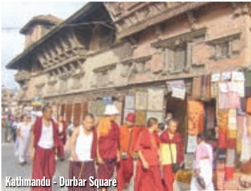
Kathmandu - Durbar Square