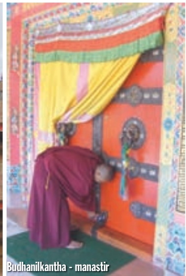
Budhanilkantha - manastir