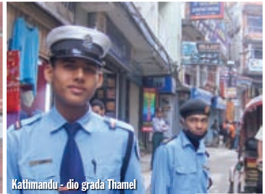
Kathmandu - dio grada Thamel

cama iz hrvatske ekspedicije treba sutradan spustiti sa vrha Cho Oyu, kojeg su neke od njih uspješno osvojile. Slavimo malo po Kathmanduu. Završili smo u nekom novootvorenom modernom kafiću.