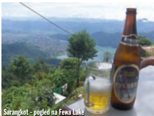
Sarangkot - pogled na Fewa Lake