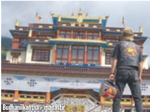
Budhanilkantha - manastir