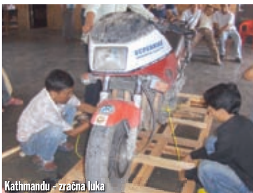
Kathmandu - zračna luka