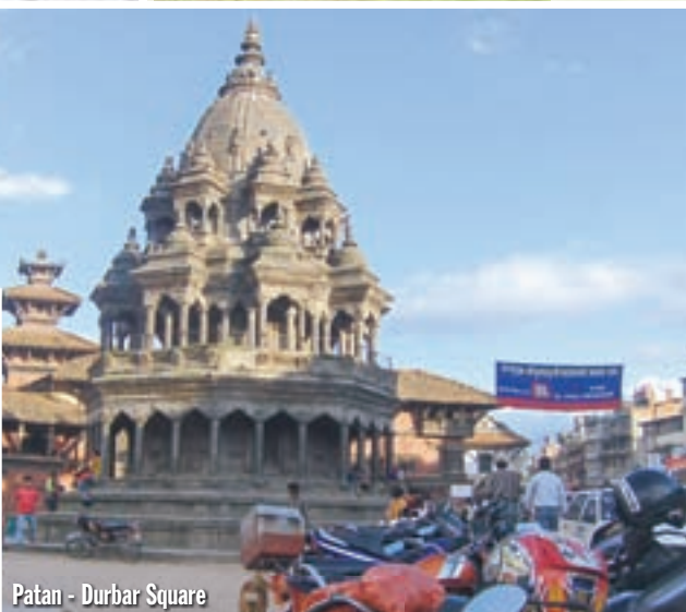
Patan - Durbar Square

gom. Pisali su zapisnike, trebalo je poništiti izlazni nepalski pečat, smijali su se, častili me čajem. Još jedna noć u hotelu Eco 2000, još jedan provod u Kathmanduu. Nisam bio ljut, naprotiv. Sutradan sam konačno odletio, oko deset navečer bio sam u Delhiu. Taksist me odveo u izvana lijep, a iznutra grozan hotel. 42 USD za noć u ovoj rupi, ali izbora nisam imao.