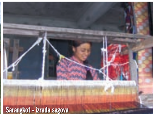
Sarangkot - izrada sagova