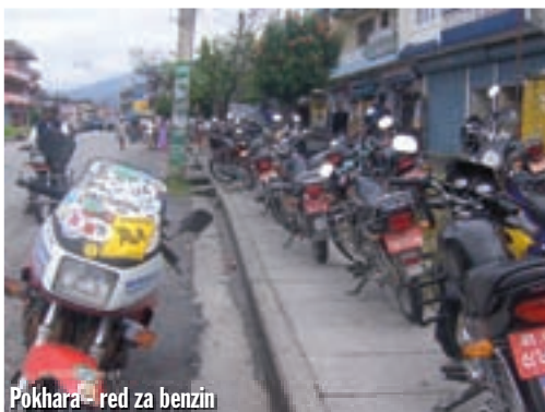
Pokhara - red za benzin