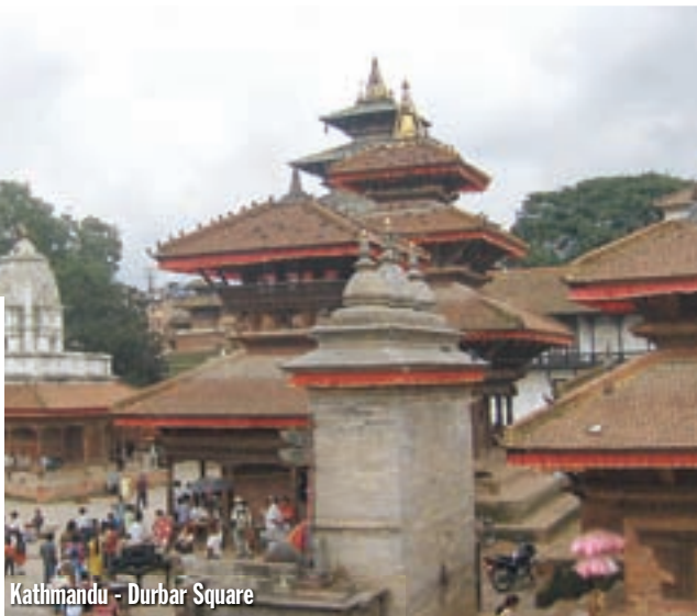
Kathmandu - Durbar Square