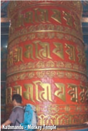
Kathmandu - Monkey Temple