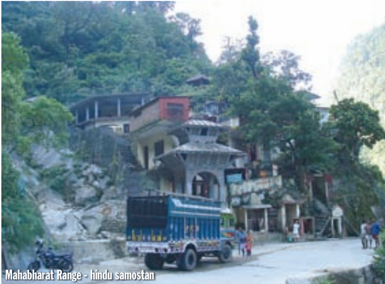
Mahabharat Range - hindu samostan