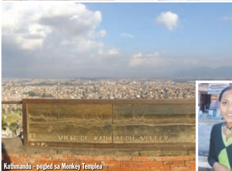
Kathmandu - pogled sa Monkey Temple