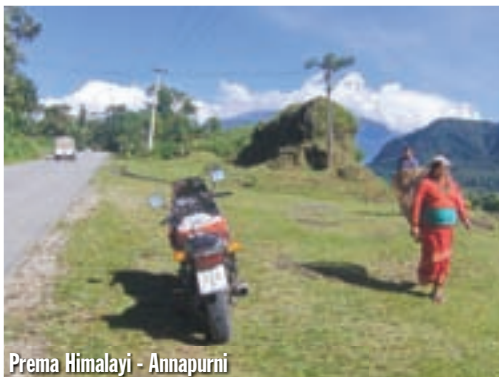
Prema Himalaji - Annapurni