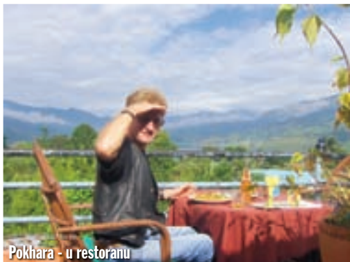
Pokhara - u restoranu

Sedmi dan u Pokhari. Borim se sam sa sobom. Preko Pakistana, tj. Baluchistana, ne usudim se vraćati sam. Ići ili ne ići, muči me danima. Onda sam ipak kupio kartu za avion. Stajalo je mnogo, mnogo novaca, za još jedno ovakvo putovanje. Toliko novaca, naravno, nisam imao, a agencija ne prima kartice. Spasio me Diners, na bankomatima mogu podići koliko god hoću. Naravno, to će trebati kod kuće vratiti. Kiša pada najjače do sada. Zadržavam se po restoranima i kafićima, druge nema. Osmi dan probudilo me sunce. Odmah na motor, a s glavne uli-