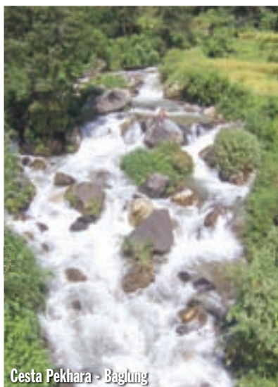
Cesta Pekhara - Baglung