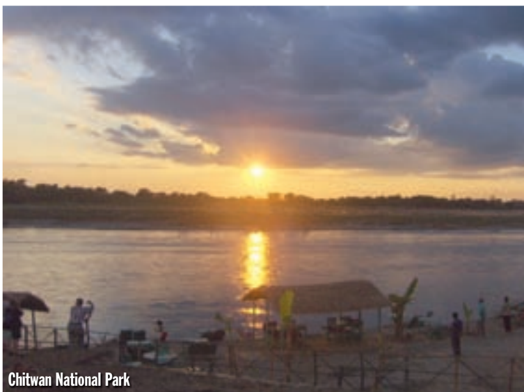
Chitwan National Park