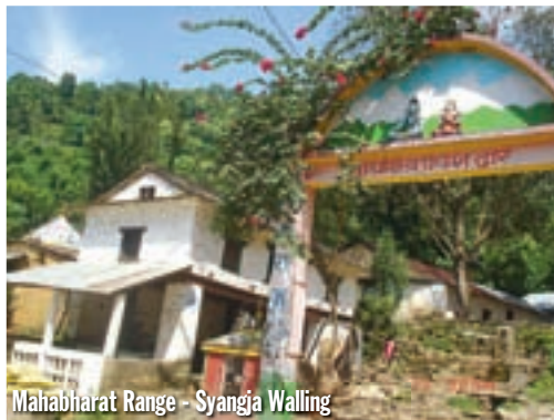
Mahabharat Range - Syangja Walling