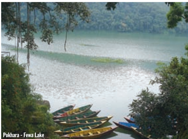
Pokhara - Fewa Lake