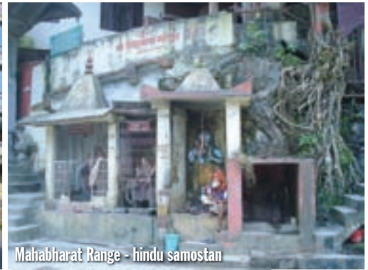
Mahabharat Range - hindu samostan