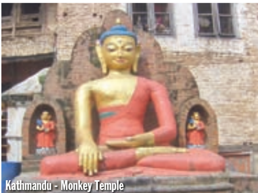
Kathmandu - Monkey Temple

po Nepalju! U agenciji računamo koliko će koštati nadoplata zbog povećanja obujma sanduka. Kaže mi Ganesh, za 10 centimetara visine još 1.175 USD. Da li je on lud, ja sam mislio da će to stajati 30-40 USD-a! Javljam da ne diraju sanduk, iščupati ću pleksi. Imam kod kuće novi, stoji 500 kuna!