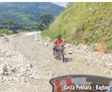
Cesta Pekhara - Baglung