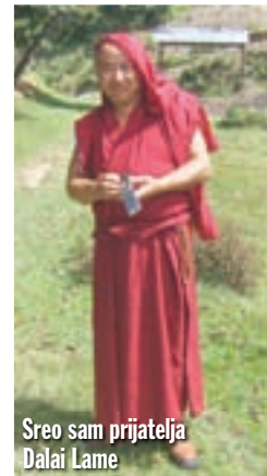
Sreo sam prijatelja Dalai Lame

Motorbike rental servise, te unajmio za sutra Bajaj Pulsar 180 DTS-i, jer Yamaha mora na aerodrom. Cijena od 500 rupija po danu (42 kune) bila mi je smiješna. Ipak taj motor u Nepalju stoji 2.500 USD. Benzin, naravno, moram posebno platiti, i to 100 rupija po litri. Royal Enfield Bullet 350 stajao bi 2000 rupija dnevno. Nije problem u novcu, nego u kurlanju, ovdje su Bulleti bez elektropokretača. Vozim Yamahom uskim ulicama Kathmandua, ima tu dosta makadama, prašine i smeća, više nego drugdje u Nepalju. Ali su moji omiljeni restorani i kafići svi na čistom, uskoro su me u mnogima već poznavali, kao što su me poznavali i u Pokhari.