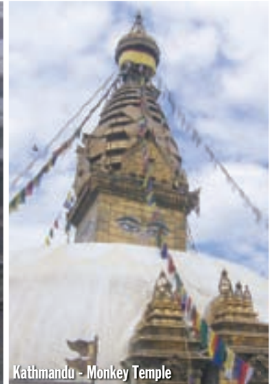
Kathmandu - Monkey Temple

hotela bez kacige, jer sam vidio neke na motorima i gologlave. Odmah me za ruku zgrabio policajac i pokazivao prstom na moju glavu. Ja sam njemu pokazivao motoriste bez kacige, ali sam onda shvatio: bez kaciga su suvozači, a vozači ih svi imaju. Takav je zakon i toga se svi drže. Mlade, lijepe djevojke na mjestu suvozača ponosno pokazuju svoju dugu, crnu kosu i baš niti jednu nisam vidio u kacigi. Uvjerio sam policajca da me pusti natrag do hotela i nisam više napravio isti incident.