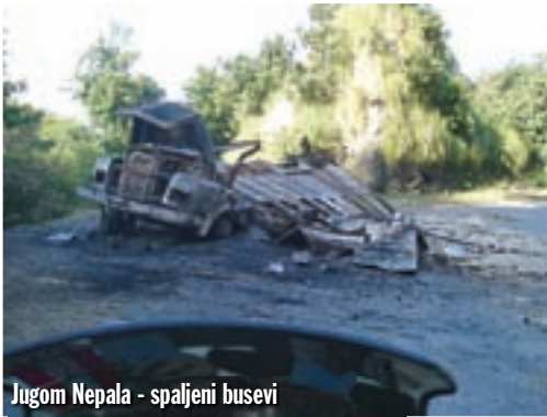
Jugom Nepala - spaljeni busevi