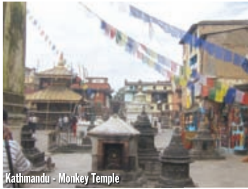
Kathmandu - Monkey Temple