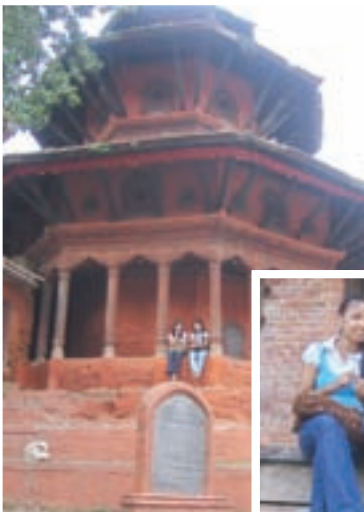
Kathmandu - Durbar Square