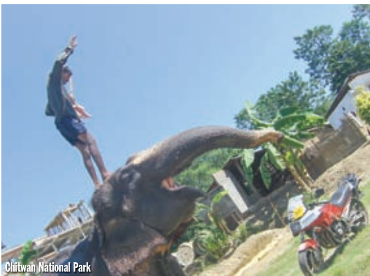
Chitwan National Park