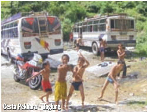
Cesta Pekhara – Baglung