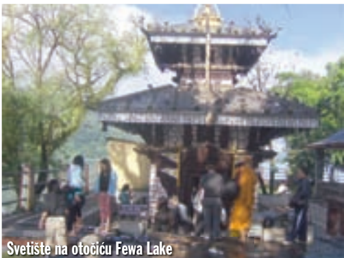
Svetište na otočiću Fewa Lake

samo biciklisti i pješaci. Nema hektike, ovdje se živi mirno. Čini mi se još mirnije nego drugdje u Nepal. Trgovina je dosta, a roba je uglavnom izložena vani, na policama ispred trgovine. Napravio sam 2-3 kruga po živopisnom gradu te krenuo natrag. Drugog puta za Pokharu nema. Na benzinskoj sam uspio uvjeriti prodavača da mi proda 5 litara benzina, iako je tvrdio da ga nema. Dobio sam ga po normalnoj cijeni. Drugih 5 litara htio sam mu platiti dvostrukom, ali nije se dao podmititi. U gradu Naya Pul probijao sam se kroz kolone autobusa punih maoista, ovdje imaju svoj skup. Mene opet nitko nije dirao. Navečer sam u moto-servisu u Pokhari dopunio zalihe goriva. Noćas mi se dogodio jedini nemili događaj za boravka u Nepal. Probudio sam se i ugledao ruku kroz rešetke prozora sobe. Instinktivno sam zaurloao, digao se napola i provjeravao da li sam sanjao. Preko mene bio je položen