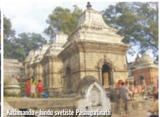
Kathmandu - hindu svetište Pashupatinath