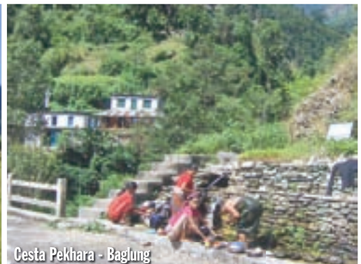
Cesta Pekhara - Baglung