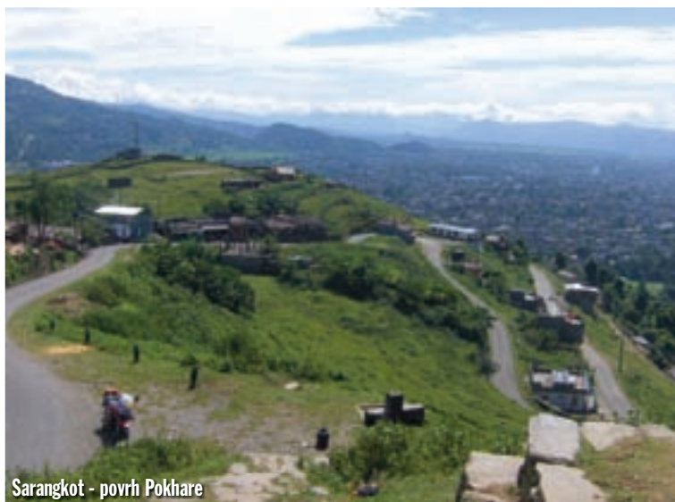
Sarangkot - površ Pokhare