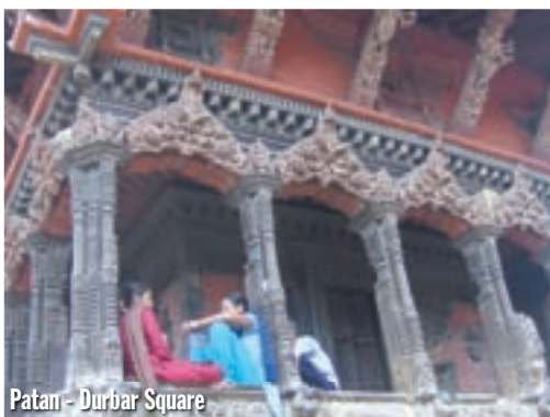
Patan - Durbar Square