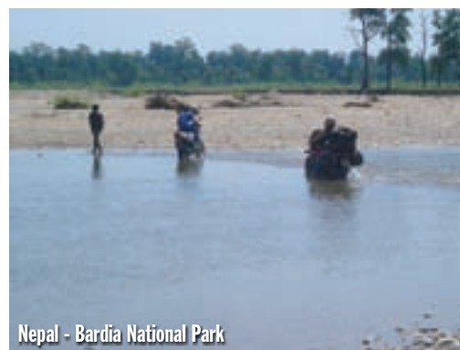
Nepal - Bardia National Park