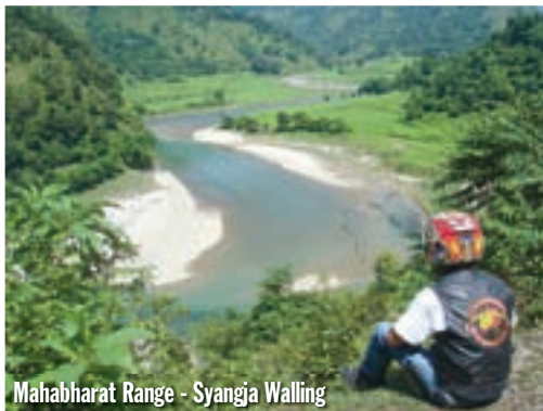
Mahabharat Range - Syangja Walling