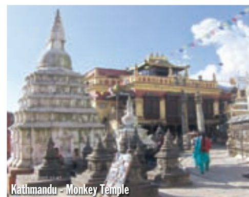
Kathmandu - Monkey Temple