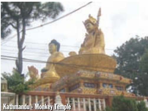
Kathmandu - Monkey Temple

Sat kasnije sam u Kathandu, tražim dio grada koji se zove Thamel. U milijunskom gradu to i nije bilo teško naći, jer je Thamel rezerviran za strance, uglavnom za alpiniste i trekere. Našao sam agenciju koju sam trebao radi poslova oko transporta motora avionom, a pored nje je bio i hotel imena Eco 2000. 8 USD za noć skuplje je nego u Pokhari, a hotel je bio lošiji, no ne i previše loš. Gostoljubivost je i u ovom velikom gradu na prvom mjestu. Thamel je prepun hotela, restorana, suvenirnica i svega što je vezano uz turizam. Sve to se odigrava u uskim uličicama, u neviđenoj gužvi. I pješaci i vozila koriste cijelu širinu ulice, pa se trubi, truba je najvažnija stvar svakog vozila. Jače su nego kod nas, tko ima glasniju sirenu, taj ima prednost i brži je. Kako se vozi puževom brzinom, ja sam Yamahom izašao iz dvorišta