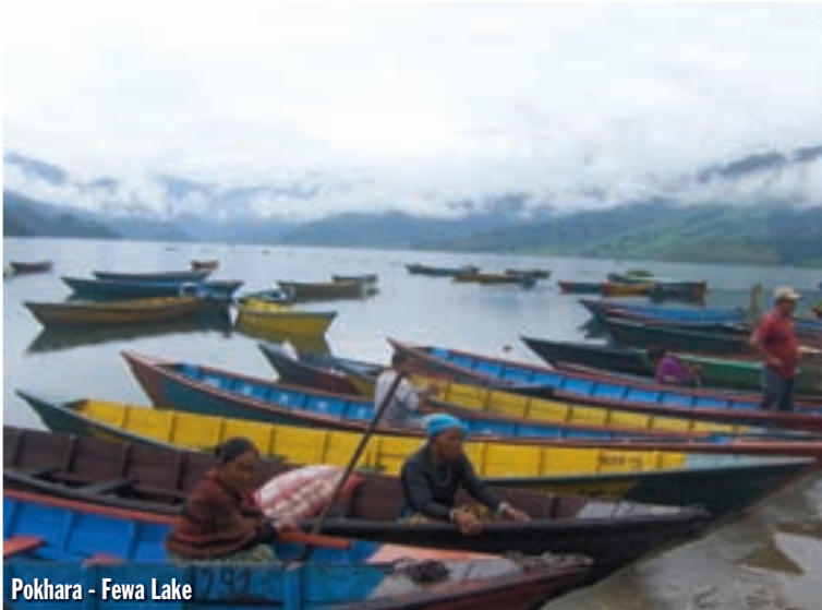
Pokhara - Fewa Lake