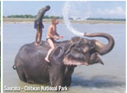
Sauraha - Chitwan National Park

slonove. Plaćam ulazninu, pa najprije razgledavam maleni muzej u kojem je objašnjeno sve o tim životinjama i njihovoj povijesti u ovim krajevima. Ovdje živi oko pedesetak ovih debelokožaca. Uglavnom su to majke sa slonićima, a dva-tri mlada slonića lutaju izvan ograde, među posjetiteljima, pa se možete igrati s njima ili ih hraniti. Treba kupiti specijalne kekse za slonove. Pješice odlazimo do rijeke, a tu čekamo pirogu da nas prebaci na drugu obalu. Promatramo stada goveda koja sa svojim pastirima prelaze rijeku, a još jednom se otvorio pogled na snježne vrhove Annapurne. U pirogu nas se ukrcalo puno previše, pa je stalno prijetila opasnost od prevrtanja, a voda, koja je navirala preko ruba, močila nam je noge. Ipak se nismo prevrnuli, a na obali nas je čekala konjska rikša koja me odvezla do mojeg bungalova.