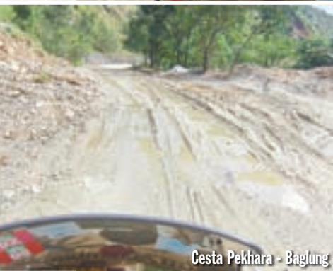
Cesta Pekhara - Baglung

štap, kojeg sam onako u panici zgrabio. Na njegovom vrhu bila je udica, kojom je lopov htio upecati moje stvari. Udica mi se zabila u ruku u predjelu zgloba i pet minuta je nisam mogao izvaditi. Ovaj događaj nije mi pokvario cjelokupan pozitivan dojam o Nepalu.