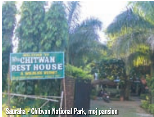
Sauraha - Chitwan National Park, moj pansion