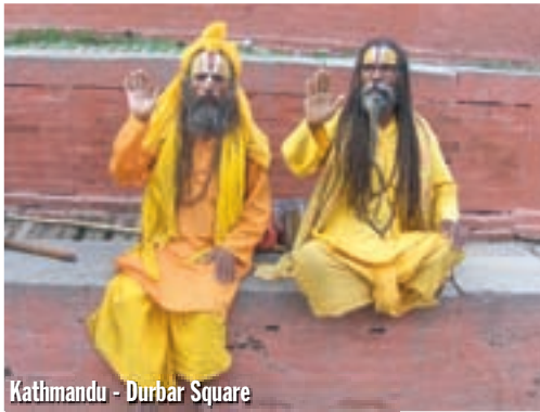
Kathmandu - Durbar Square