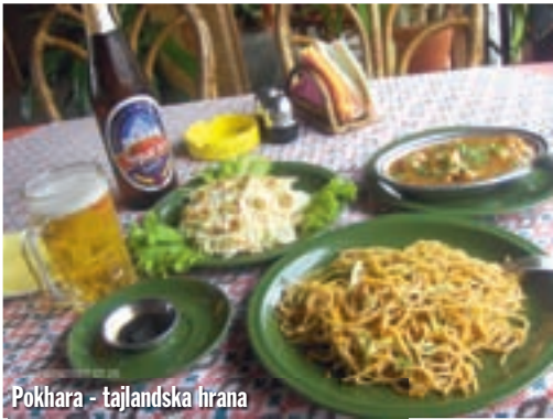
Pokhara - tajlandska hrana