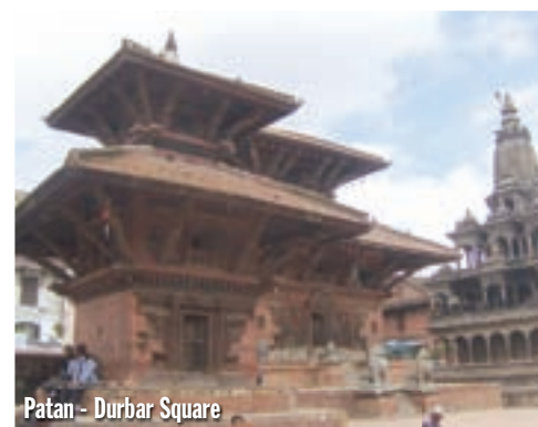
Patan - Durbar Square

Gume sam dopremio kući nove, osim pokvarenog brzinomjera, nikakve kvarove nisam imao. Vratio sam se sa samo jednim cijelim žmigavcem. A ja sam živ i zdrav, spreman za nove avanture! ■