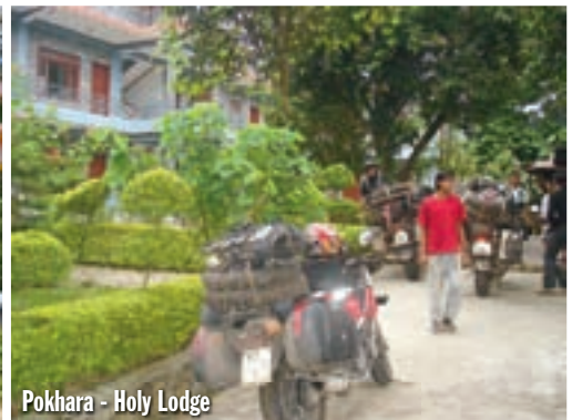
Pokhara - Holy Lodge

se odvojio od prijatelja, vezao nas je još samo isti pansion u kojem smo stanovali, te pokoji susret u kafiću. Prilikom ručka u restoranu 'Lemon Tree' prišao mi je Europljanin, upitavši me da li je to moj motor vani. Bio je to Englez, a njegov BMW F650 parkiran je stotinjak metara odavde. Njegov kolega imao je sudar s kravom u Indiji te sada tamo čeka da mu stigne uljni hladnjak, pa će i on u Nepal. Bio je to jedini europski biker kojeg sam sreo na cijelom ovom putu, uključujući i bliže zemlje kao što su Turska i Grčka! Nakon odličnog ručka navratio sam do pansiona, a tamo su po pljusk upravo stigli Nijemac sa djevojkom, te Nepalac, na dva iznajmljena Royal Enfielda 350. Nijemac je već iskusan Nepalac i često je u ovim krajevima, stoga i ima prijatelja u Nepal.