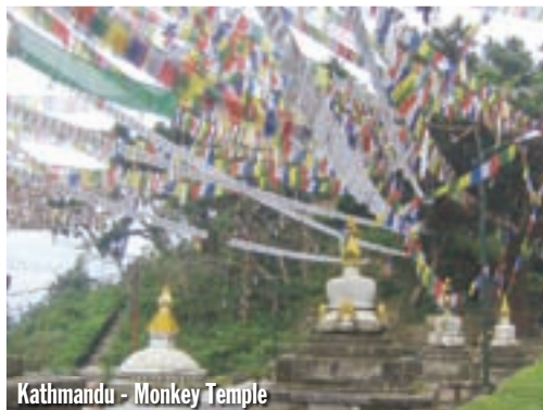
Kathmandu - Monkey Temple