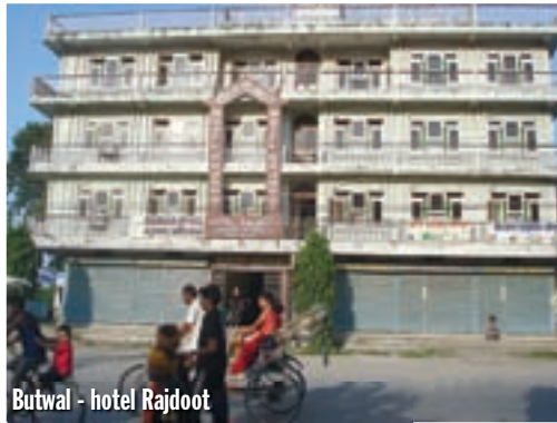
Butwal - hotel Rajdoot