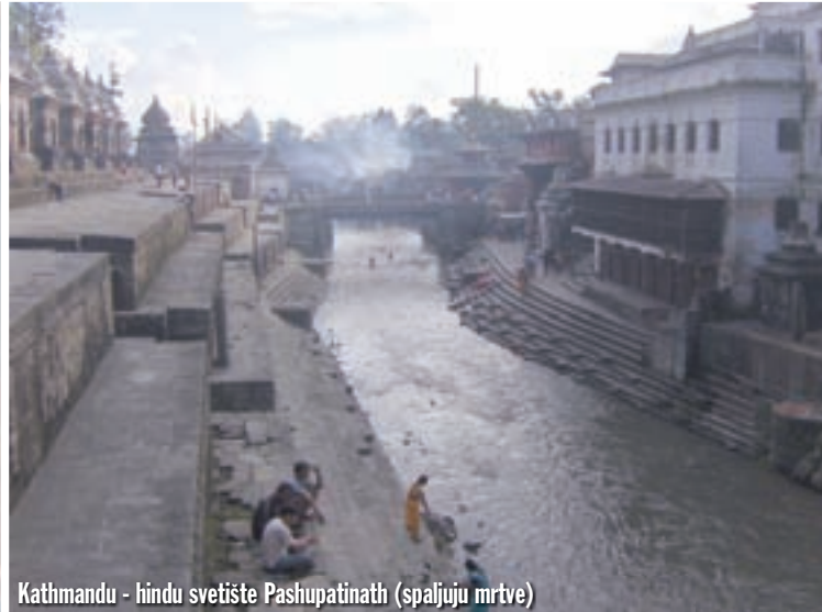
Kathmandu - hindu svetište Pashupatinath (spaljuju mrtve)