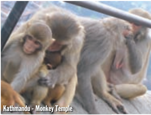
Kathmandu - Monkey Temple