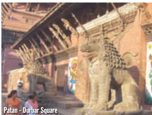
Patan - Durbar Square