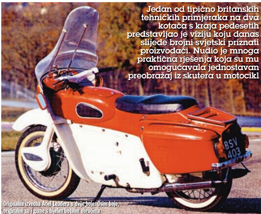
Originalna izvedba Ariel Leadera u dvije boje. Osim boje, originalne su i gume s bijelim bočnim obručima

Jedan od tipično britanskih tehničkih primjeraka na dva kotača s kraja pedesetih predstavljao je viziju koju danas slijede brojni svjetski priznati proizvođači. Nudio je mnoga praktična rješenja koja su mu omogućavala jednostavan preobražaj iz skutera u motocikl