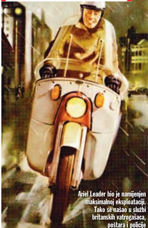
Ariel Leader bio je namijenjen maksimalnoj eksploataciji. Tako se našao u službi britanskih vatrogasaca, poštara i policije