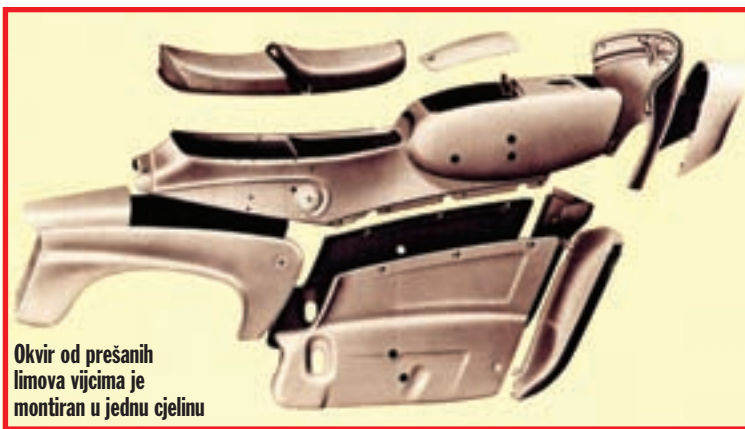
Okrvir od prešanih limova vijcima je montiran u jednu cjelinu

Ariel Leader imao je čak i električne pokazivače pravca.