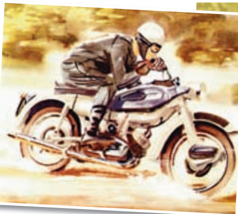
Nekoliko rukom rađenih reklamnih plakata iz 1958. prikazivalo je Ariel Leader u sportskoj izvedbi gore, naked desno, i zatvorenoj verziji

nog vozila. Od njegovog vremena prošlo je točno 50 godina, pola stoljeća. Iako su motocikli u to vrijeme bili opremljeni vrlo skromno,