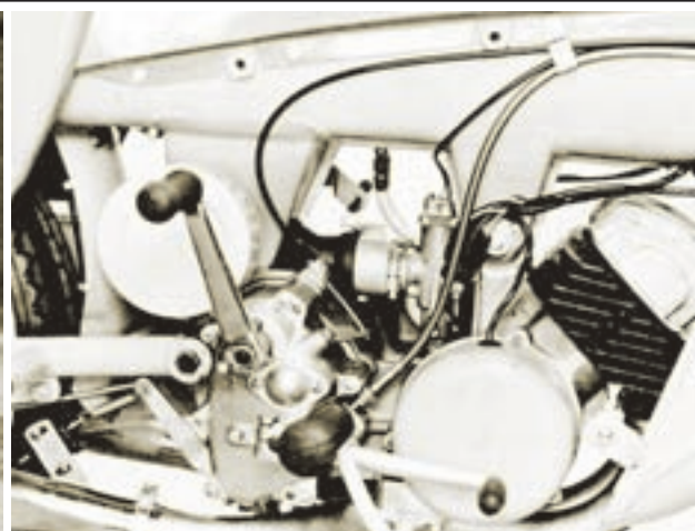
Ariel Leader 250 u izvedbi super sport, s 20 KS pri 6600 okr/min dosezao je 125 km/h. Malo spušten upravljač i vjetrobrana odavao je njegov sportski karakter, a bio je čak dvadeset kilograma lakši od zatvorene verzije!