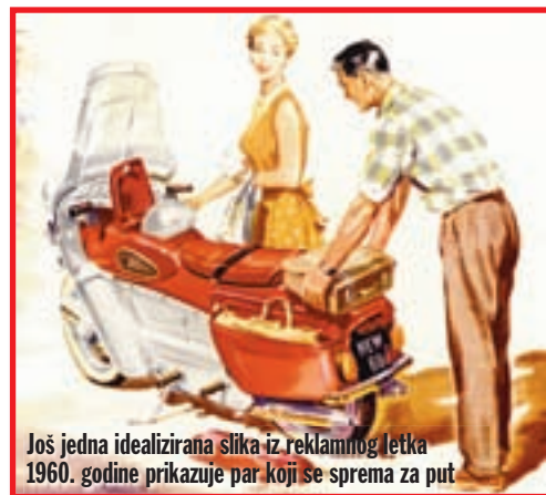
Još jedna idealizirana slika iz reklamnog letka 1960. godine prikazuje par koji se sprema za put

nom, maksimalno su štitili vozača. Udobnost je prva velika prednost ovog skutera. Motociklistima često ponestaje prostora za prtljagu, ali ovdje su konstruktori razmišljali upravo u tom smjeru. Skuter je imao četiri prtljažna prostora: jedan na vrhu rezervoara za osobne potrebe vozača, klasičan nosač prtljage iz sjedala suvozača, te još dva stilski dotjerana putna kovčega, po jedan sa svake strane. Nema sumnje da je praktičnost bila na prvom mjestu dizajnerima ovog neobičnog, ali vrlo simpatič-