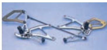
▲ Kvalitetni materijali i minimalistička konstrukcija čine ovaj set pedala, odnosno nožnih komandi, izuzetno laganim elementima

Magnezij je laki metal (24.31 Am), koji je legiran s aluminijem (obično lijevanjem). Iako lagan, dosta je krt,