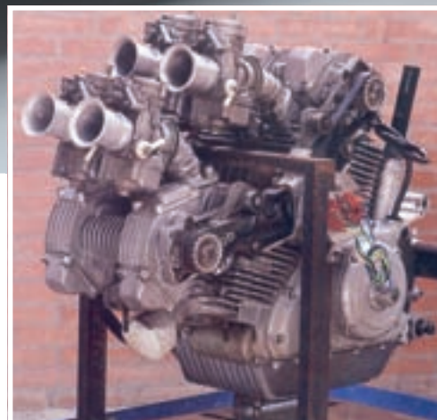
▲ Bipantah je drugi četverocilindrični motor iz osamdesetih u V izvedbi, koji je poput Appola ostao u skladištu tvornice. Na slici su vidljivi zupčasti remeni za pogon bregastih osovina i četiri karburatora

Vratimo se činjenicama: "Želimo proizvesti san, san koji će na koljena baciti sve ostale, a posebno one u GP-u". Bila je to prepotentna izjava Claudija Domenicaliija, odgovornog voditelja projekta Desmosedici.