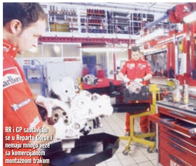
RR i GP sastavljaju se u Reparto Corse i nemaju mnogo veze sa komercijalnom montažnom trakom

i generatorom za proizvodnju električne energije. Osim toga, grupa zupčanika za prijenos, te pumpa za ulje i vodu smješteni su na desnu stranu agregata, tako da se karter razlikuje od GP-ovog. No, iako je ovaj agregat potpuno nov, nasljedstvo bicilindraša i u ovom je slučaju vidljivo. Naime, moglo bi se reći da su spojena dva Ducatijeva agregata u poznatoj L konfiguraciji. Tako sada imamo dva spojena cilindra umjesto jednog, tradicionalnog, dakle horizontalni par plus vertikalni par. Glave su također odlivene u komadu sa po četiri ventila u prizmastom kompresijskom prostoru. Kut između ventila iznosi 15 stupnjeva. Novost je svakako kaskada cilindričnih distribucioni zupčanika koji pokreću dvije bregaste osovine, po jednu usisnu i ispušnu. Ta promjena donosi veću točnost i sigurnost u odnosu na bicilindrične Ducatije, koji za distribucioni prijenos koriste zupčaste