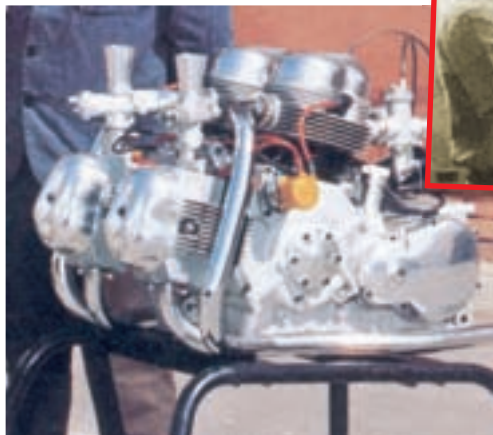
Ducati Apollo, četverocilindrični longitudinalni četverotaktni V 90 motor bio je zrakom hlađen sa četiri rasplinjača i četiri stupnja prijenosa. Dolje je Fabio Taglioni, otac svih Ducatija od pedesetih do osamdesetih godina prošlog stoljeća