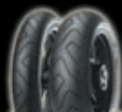
DRAGON SUPERCORSA PRO SC

Jesenski popust od 20 % na gume sa lagera