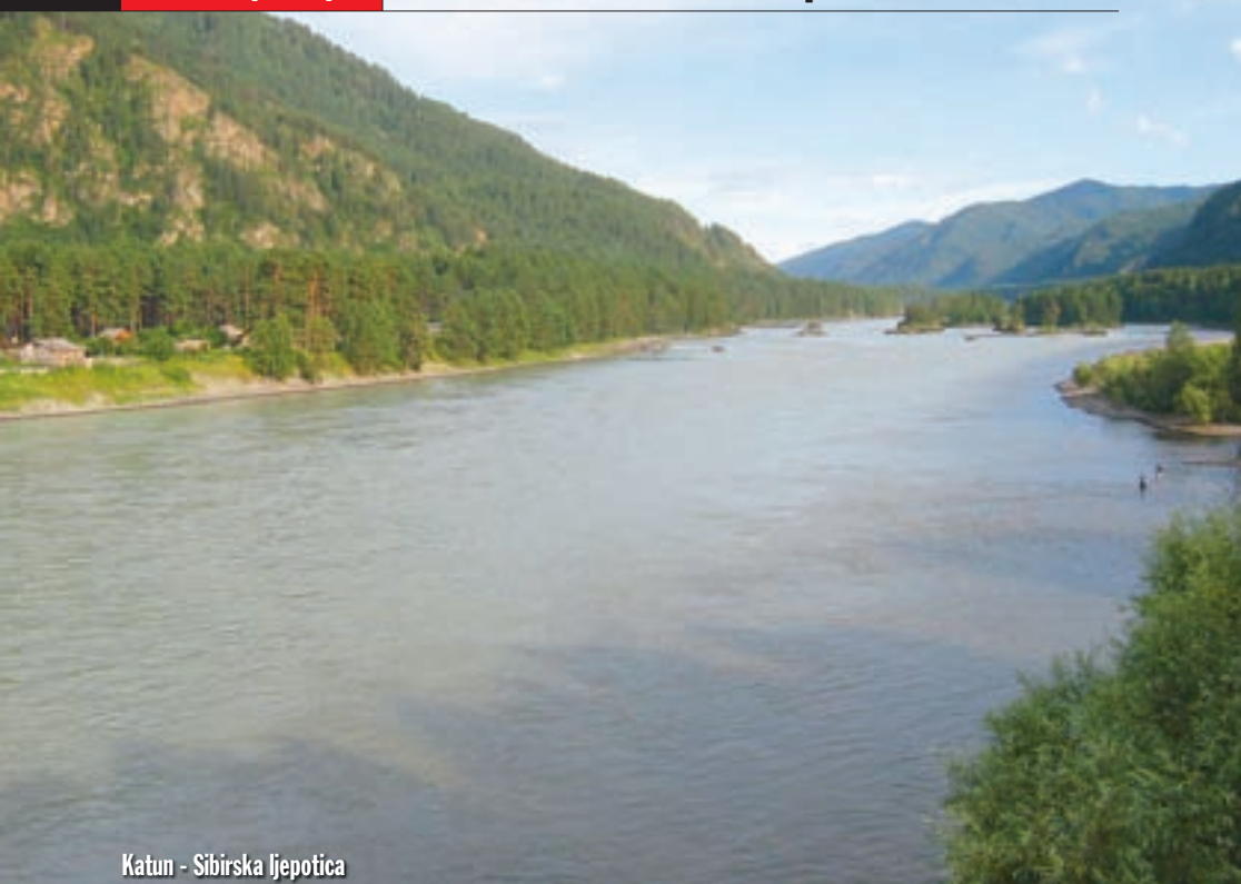
Katun - Sibirska ljepotica

za pustolovni turizam... Nismo mnogo otezali s ručkom. Priče o ljepotama ovoga kraja bile su mnogo intrigantnije od umora.