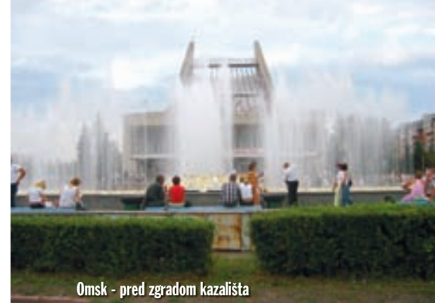
Omsk - pred zgradom kazališta