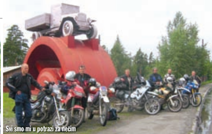
Svi smo mi u potrazi za nečim

nizaciju povratka kući. Prvi podaci koje smo uspjeli sakupiti nisu bili obećavajući. Gotovo nitko nije bio sposoban preuzeti prijevoz motocikla direktno u Hrvatsku, a cijene onih koji su to mogli višestruko su premašivale njegovu vrijednost. A i činjenica da je uvršten i u vizu sada je bila otežavajuća okolnost. Treba proći zbog toga i kompliciranu rusku birokraciju.