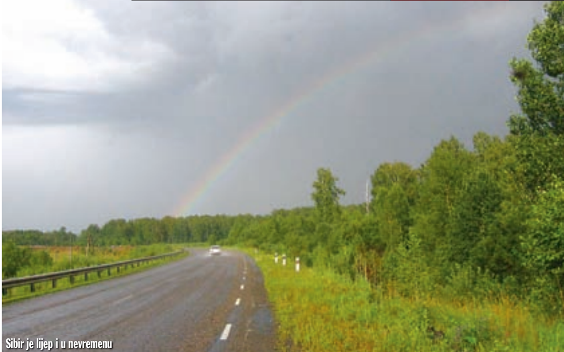
Sibir je lijep i u nevremenu