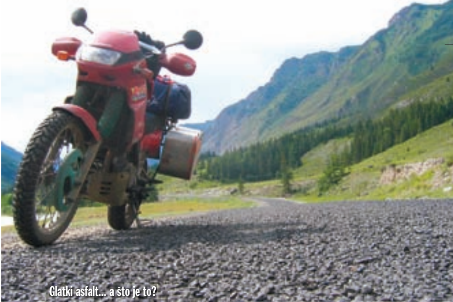
Čistki asfalt... a što je to?