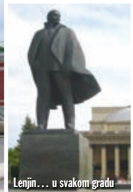
Lenjin... u svakom gradu