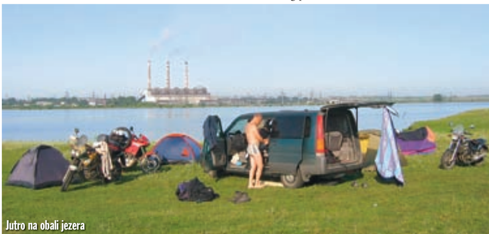
Jutro na obali jezera

A onda sam se jednoga jutra trgnuo iz sna, probudio se, i kao da mi je nešto govorilo: "Sjećaš li se ti onog prohladnog svibanjskog jutra... sjećaš li se ti nebeskog putnika..." ■