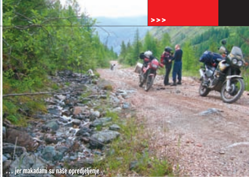
... jer makadami su naše opredjeljenje

zato većinu puta naš najveći neprijatelj bila vrućina. U Kemerevo smo stigli oko podne. Stari dio grada je lijep, ali se odlučujemo za varijantu u kojoj će nam više vremena ostati za područje Sajani planina. Priroda nam je sada u prvom planu. Pred noć zastajemo u gradiću Marinsku, koji se smjestio na raskrsnici rijeke Kiya i transsibirske željeznice. Raspitujemo se o mogućnosti kampiranja. Upućuju nas na jezero podalje od grada. Silazimo na makadam. Široka ravna cesta trebala nas je odvesti ravno do jezera.