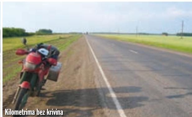
Kilometrma bez krivina