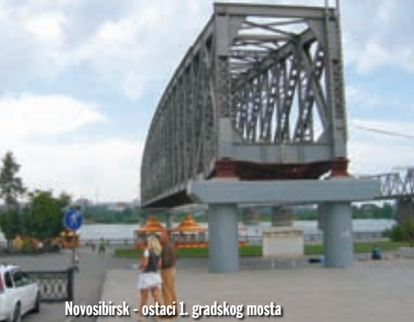
Novosibirsk - ostaci 1. gradskog mosta