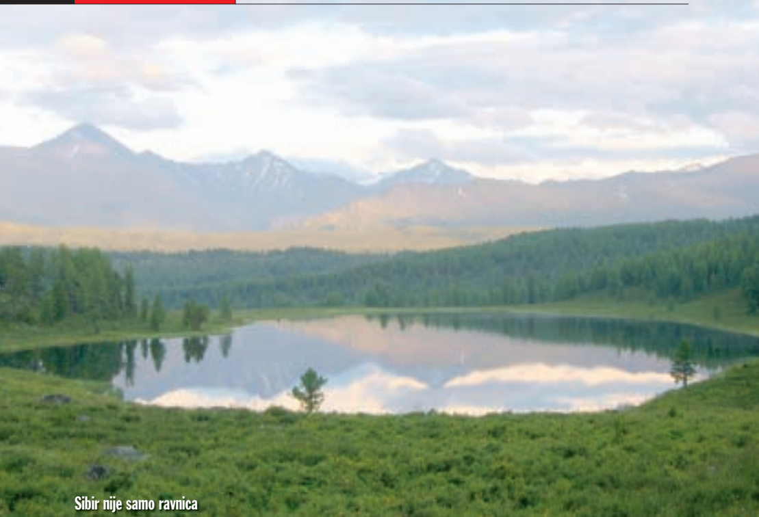
Sibir nije samo ravnica

trebam gutljaj vode. Aleksej i doktor žele da sjednem, skidaju mi cipele, pokazuju kako da dišem, da se opustim. Mašu mi nečim ispred glave kako bi me osvježili.