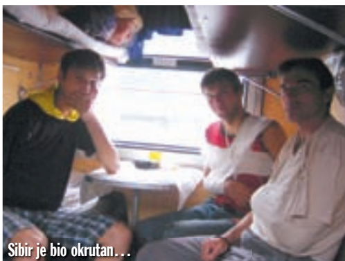
Sibir je bio okrutan...