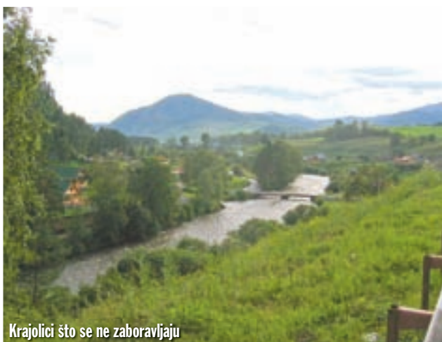
Krajolici što se ne zaboravljaju