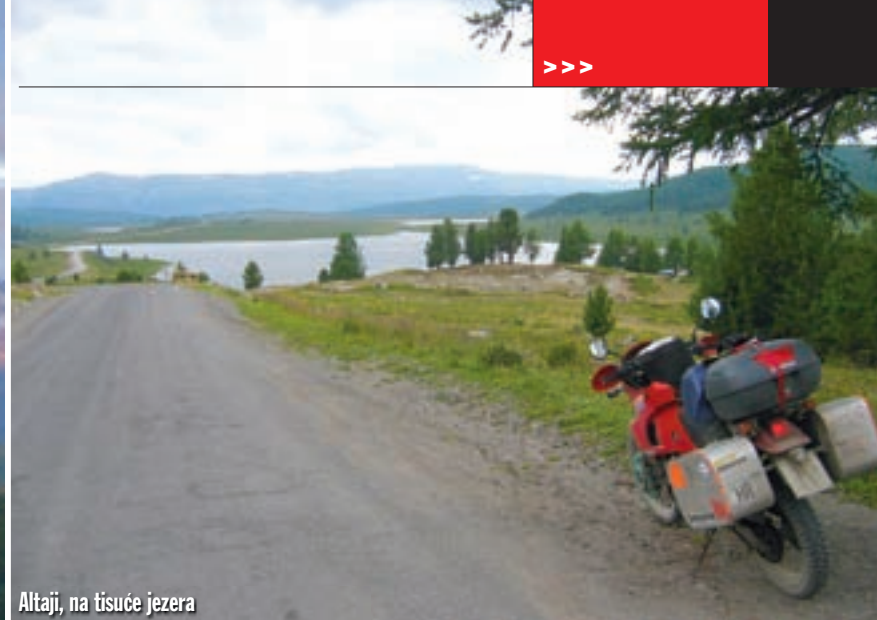
Altaji, na tisuće jezera

nam napisali izvještaj, dali potvrdu. Dobrih smo sat vremena ispunjavali razne papire, da bi, nakon što smo završili, policajac predložio da možemo motocikl, naravno besplatno, ostaviti u njegovoj garaži. Pogledali smo se, nasmijali i naravno, pristali. Gomilu papira zamijenila je jedna dobra gesta nepoznatog čovjeka.