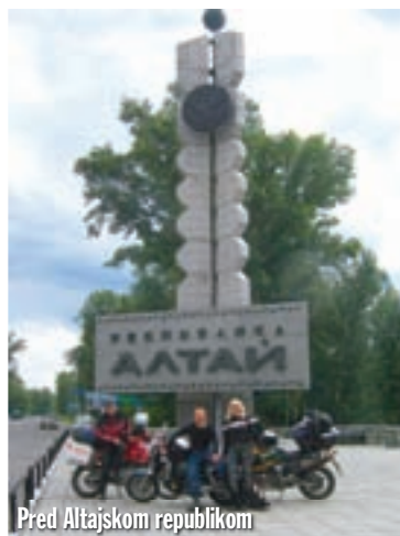
Pred Altajskom republikom