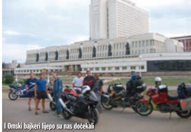
I Omski bajkeri lijepo su nas dočekali