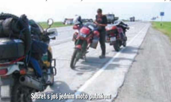
Susret s još jednim moto putnikom

Već je bilo 10 sati uvečer kada smo izašli iz grada. Promet je bio poprilično gust na cesti za Barnaul,