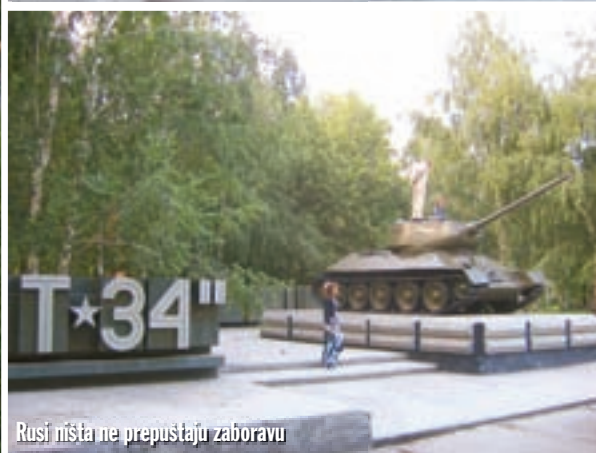
Rusi ništa ne prepuštaju zaboravu

damom. Podloga je bolja i lakša za vožnju od mnogih asfaltnih dionica na dosadašnjem putu. Iza svakog motocikla dizao se oblak prašine, a kada smo stigli na vrh odijelo mi je već poprimilo žučkastu boju makadama. Izašavši iz područja šuma našli smo se na platou na visini od oko 2000 metara. Tek ovdje postaje jasnija priča o Altajskih 6000 jezera i 10000 rijeka, rječica i potoka. Na horizontu vidimo visoke planine čiji su vrhovi još pokriveni snježnom kapuljačom. Sretan sam što i ja imam privilegij biti na jednom ovako impresivnom mjestu.