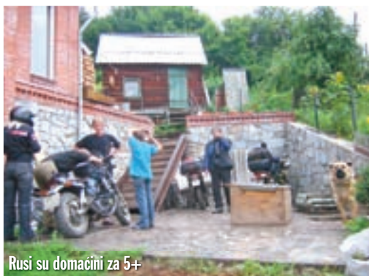
Rusi su domaćini za 5+