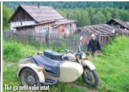
Tko ga nebi volio imat

Unutra je oko 5 stupnjeva. Izašao sam van. Vrhovi okolnih planina jutros su bili prekriveni novim snijegom. Ništa neuobičajeno za ove krajeve, pričaju mi, dok sam se pokušavao ugrijati uz jutarnji čaj. Kako se sunce izdizalo nad horizontom nestajalo je one jutarnje hladnoće. Biti će to još jedan ugodan dan za vožnju. Carstvo prirode i danas će voditi glavnu riječ. Krenuli smo natrag. Altaji se cijelim putem nisu prestajali praviti važni.