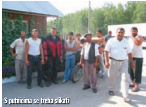
S putnicima se treba slikati

Altajsko gorje proteže se na 4 države: Rusiju, Kazahstan, Kinu i Mongoliju. Najviši dijelovi nalaze se na području Rusije. Ime gorja dolazi od mongol-