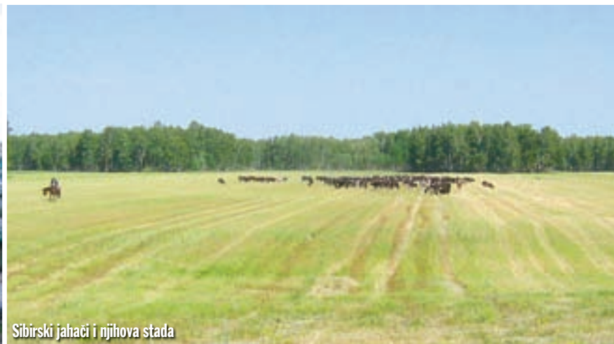
Sibirski jahači i njihova stada

čuvár predložio nam je da podignemo šatore, što smo nakon večere i učinili. Još jedan pozitivni primjer ruske gostoljubivosti na koju smo gotovo redovito nailazili uzduž našega puta.