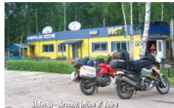
Stolovaja - skromno, jeftino al' dobro

Gotovo da nismo mogli poželjati bolje vodiče za obilazak grada nego što su to profesor povijesti, mada trenutno građevinski poduzetnik, i profesorica na novosibirskom univerzitetu. Novosibirsk je grad koji mi se na prvi pogled nije svidio, ali kojeg ću imati prilike upoznati gotovo detaljno. Sa milijun i pol stanovnika Novosibirsk je po veličini treći grad u Rusiji, a najveći u Sibiru. Sagrađen je krajem 18. stoljeća uz rijeku Ob, kao buduće željezničko čvorište. Njegovo prvotno ime bilo je Novonikolajevsk. Kada je "narod" odlučio promijeniti ime, gotovo