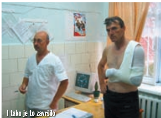
I tako je to završilo