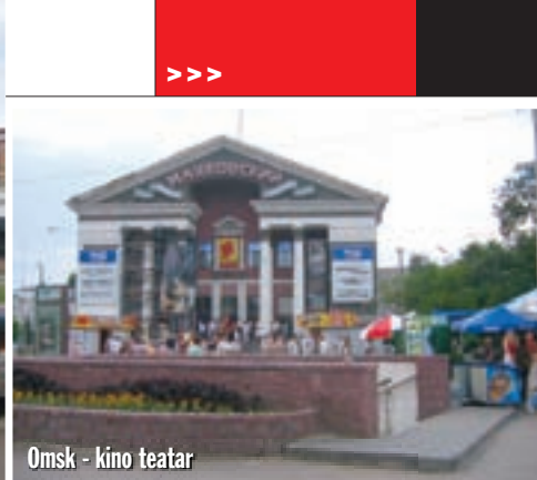
Omsk - kino teatar