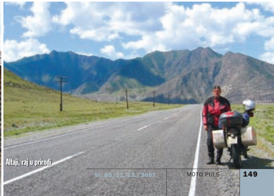
Altaji, raj u prirodi