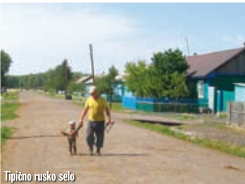
Tipično rusko selo