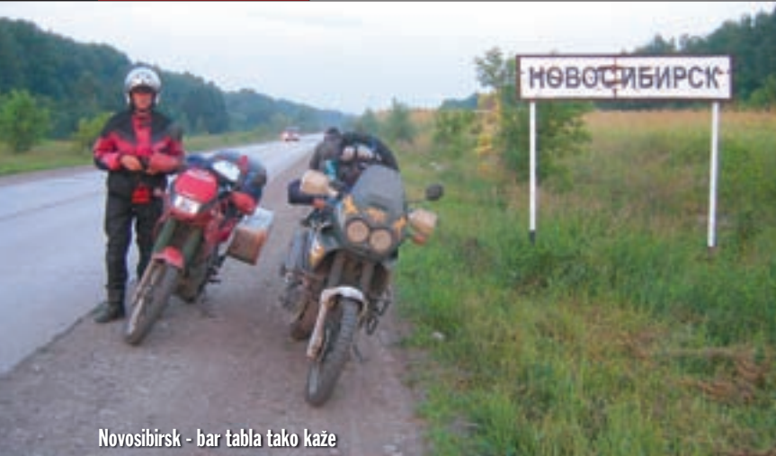
Novosibirsk - bar tabla tako kaže