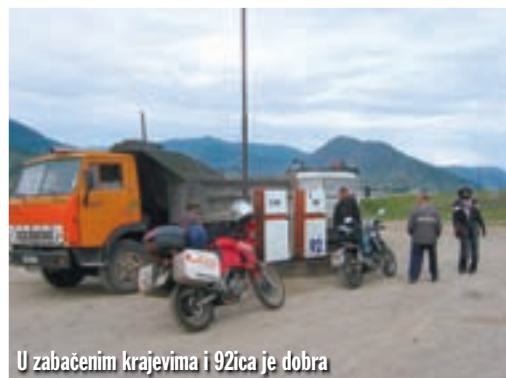
U zabačenim krajevima i 92ica je dobra

Jutro je, sipi lagana kišica, ali treba krenuti. Samo što smo izašli iz grada na 'Africi' se ponovno probušila guma, ovoga puta rasprsla se oko ventila. Nikolaj je za dvadesetak minuta već bio kod nas s kombijem. U vulkanizerskoj radnji imali su i novu zračnicu,