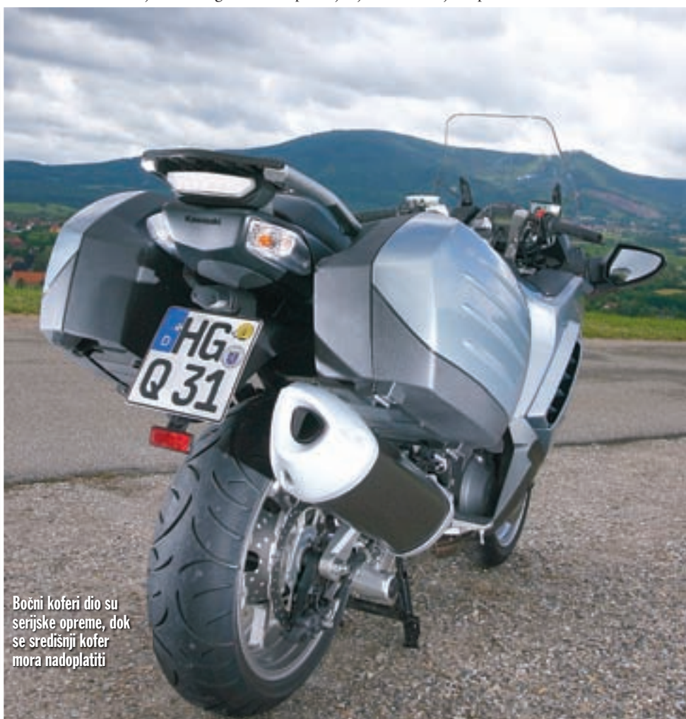
Bočni koferi dio su serijske opreme, dok se središnji kofer mora nadoplatiti

● Iako je Kawasaki s GTR-om 1400 ušao u sasvim novi tržišni segment, taj motocikl ima svog ne tako dalekog pretka u putnom modelu GTR 1000, koji se na tržištu našao davne 1984. godine i dijelio pogonski agregat s GPZ-om 1000 RX. Uz neke se promjene GTR 1000 proizvodio sve do početka ovog tisućljeća, a u svojem je posljednjem izdanju raspolagao sa sasvim solidnih 98 KS koje je razvijao pri 9.000 okr/min (u verziji za američko tržište čak i 12 KS više), što je bilo sasvim dovoljno za agilno pokretanje 273 kg teškog motocikla. Jednako kao i njegov nasljednik, GTR 1000 je svojedobno važio za nešto sportskijeg pripadnika touring klase, no bez obzira na izražene vibracije bio je u prvom redu namijenjen dugim putovanjima, o čemu svjedoči i spremnik goriva od 28,5 l. Iako ga rijetko vidamo na našim cestama, širem pučanstvu mogao bi biti poznat kao prateće vozilo na biciklističkim utrka tipa Tour de France.