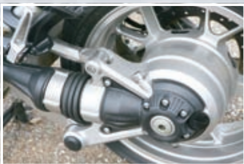
Tetra-lever sustav stražnjeg ovjesa dobro "skriva" nedostatke kardanskog prijenosa

kraju motocikla, koji je udomio čvršći stražnji kotač i veći disk promjera 270 mm, a o ozbiljnosti kojom su Kawasakijevi inženjeri prionuli stvaranju ovog modela svjedoči i to da je s obzirom na njeno očekivano češće korištenje poluzi stražnje kočnice dodatno povećana kontaktna površina. No to je samo kap u moru promjena koje je ovaj motocikl morao proživjeti kako bi se iz lovca na brzine pretvorio u uglađenog gospodina, a jedna od značajnijih je prigušivanje pogonskog agregata kako bi se bolje snašao u novim radnim uvjetima. Najzvučnija novost je svakako ugradnja varijabilnog sustava upravljanja ventilima, no redni je četverocilindraš pretrpio i sijaset drugih promjena, koje uključuju smanjenje stupnja kompresije sa 12:1 na 10,7:1, povećanje mase zamašnjaka i ugradnju manjih leptirastih tijela promjera 40 mm. Svaka od tih promjena trebala bi pridonijeti boljem razvijanju snage na niskim i srednjim okretajima, a tretman prilagodbe novim zahtjevima prošao je i ispušni sustav koji sada posjeduje samo jedan prigušivač, ali i neki periferni uređaji poput hladnjaka, koji je dobio još jedan ventilator.