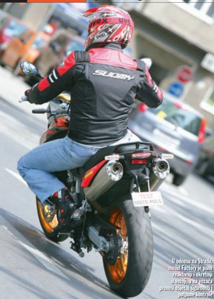
U odnosu na Stradu, model Factory je puno reaktivniji i okretniji u vožnji, a na vozača prenosi osjećaj sigurnosti i potpune kontrole