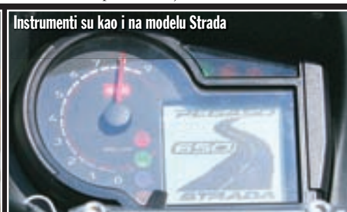
Instrumenti su kao i na modelu Strada