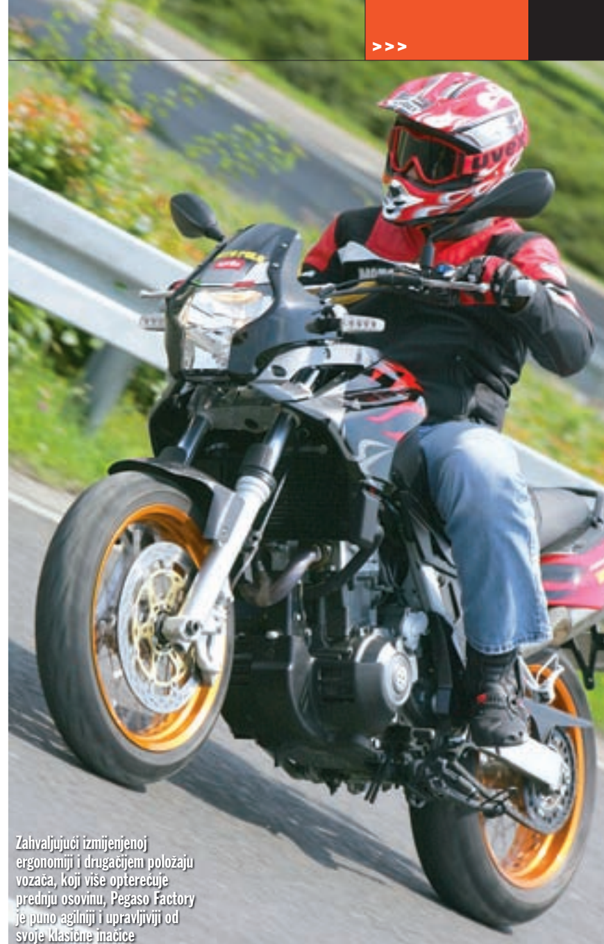
Zahvaljujući izmijenjenoj ergonomiji i drugačijem položaju vozača, koji više opterećuje prednju osovinu, Pegaso Factory je puno agilniji i upravljiviji od svoje klasične inačice

Kao točka na "i" koja zaokružuje ovu cjelinu i osigurava hard karakter Factoryu tu su dijelovi vanjskih oplata od ugljičnih vlakana. Za razliku od standardnog Pegasa, "racing" verzija