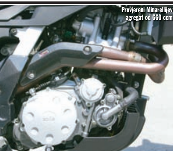
Provjereni Minarellijev agregat od 660 ccm

Da je riječ o modelu potpuno drugačijeg usmjerenja Factory daje do znanja čim se nađete u njegovom sjedalu. Kao prvo, standardni upravljač, kojem smo na serijskoj inačici zamjerali što je previše zatvoren na krajevima, sada je zamijenjen gotovo potpuno ravnim natjecateljskim cross aluminijskim upravljačem promjenjivog presjeka. Osim što je drugačije izvedbe, upravljač je postavljen i na veću visinu zahvaljujući višim držačima upravljača, "konjčićima", koji neodoljivo nalikuju na one koje vidamo na naked modelu Tuono Factory. Tu je i sjedalo motocikla, koje je drugačije profilirano i bolje podstavljeno, kako bi se ostvarilo još agresivniji položaj vozača. Krajnji rezultat ovog zahvata je nova vrijednost visine sjedala, koje je sa 780 mm podignuto na 800 mm. Zahvaljujući