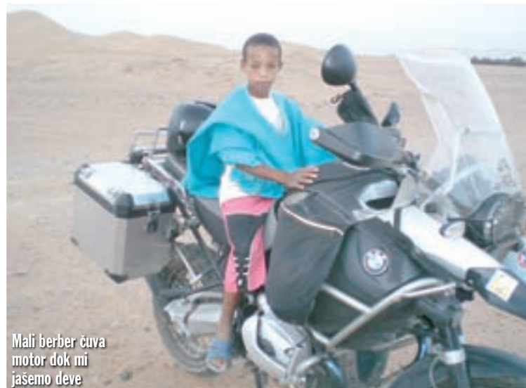
Mali berber čuva motor dok mi jašemo deve

Sva sela kroz koja smo prolazili na putu do Sahare bila su u mraku, pa smo se teško orijentirali. Na našu radost, bar se vrućina smanjila. Tortura je trajala do ponoć i pol, kada smo napokon mrtvi umorni stigli u hotel. Pišem na papir prije