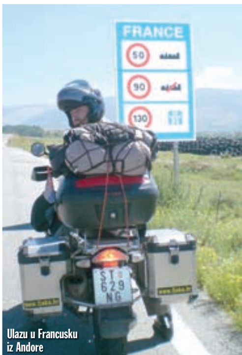
Ulazu u Francusku iz Andore