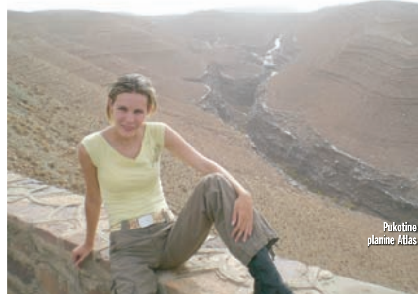
Pukotine planine Atlas