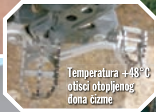
Temperatura +48°C otisci otopljenog đona čizme