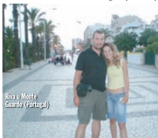
Riva u Monte Guardo (Portugal)