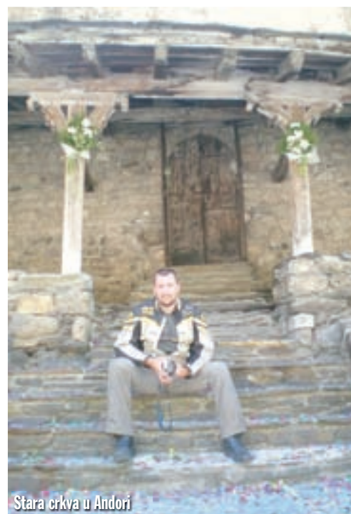
Stara crkva u Andorji

Na stotine motora i bajkera, sve je puno dućana s motorističkom