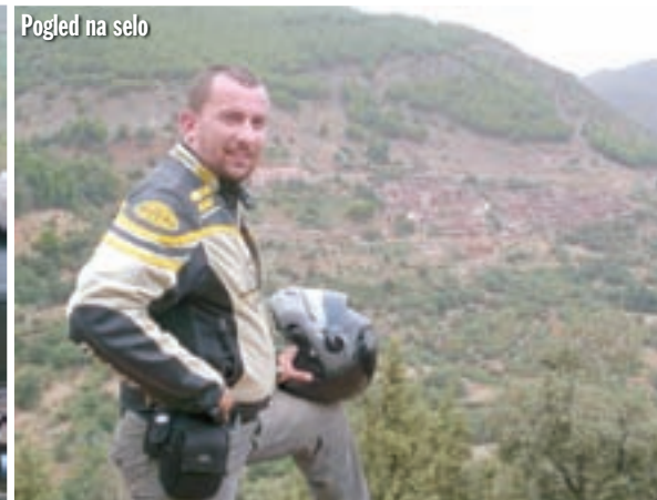
Pogled na selo