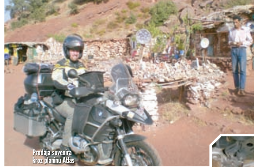
Prodaja suvenira kroz planinu Atlas