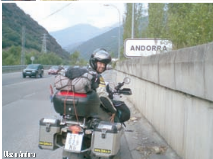
Ulaz u Andorru

Na jednom se mjestu okrećem na silu - ulazim prednjim kotačem u nečija vrata, ona pupuštaju, pa okrećem BMW i pravac natrag. Poslije potrage nailazimo na hotel za 42 eura.