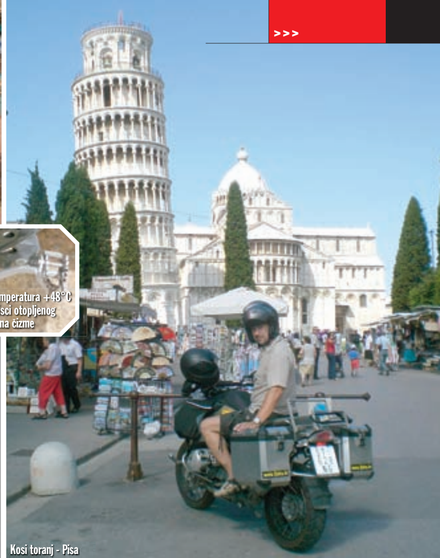
Kosi toranj - Pisa

astronomskih cijena, pa odlazimo. U Perpiganu su nam servirali neku smrdljivu kobasicu koja nije uopće bila jestiva. Punimo gorivo - 34 litre 48 eura, lijepo bome... Oko 20h smo ušli u Španjolsku. Htjeli smo se spustiti do obale, ali smo malo "zabucali" u noći, pa se vraćamo u grad Girona. Tamo jedva nalazimo hotel za 60 eura, jer je nam je nekoliko ugostitelja reklo da nemaju smještaja. Mislim da je to i zbog predrasuda prema bajkerima. Na kraju dana vidimo da smo opet potrošili 200 eura. Prešli smo 620 km, sveukupno 1470 km.