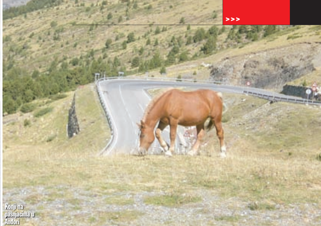
Konji na pašnjacima u Andori