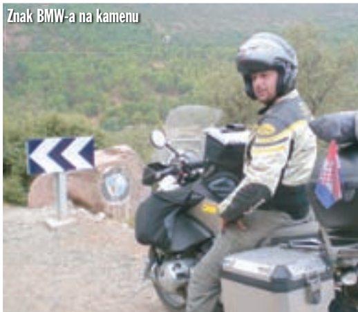
Znak BMW-a na kamenu