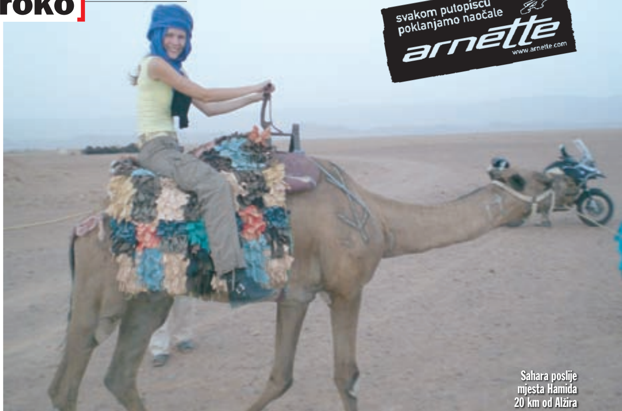
Sahara poslije mjesta Hamida 20 km od Alžira