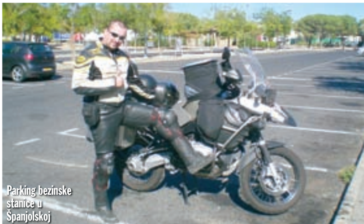
Parking bezinske stanice u Španjolskoj