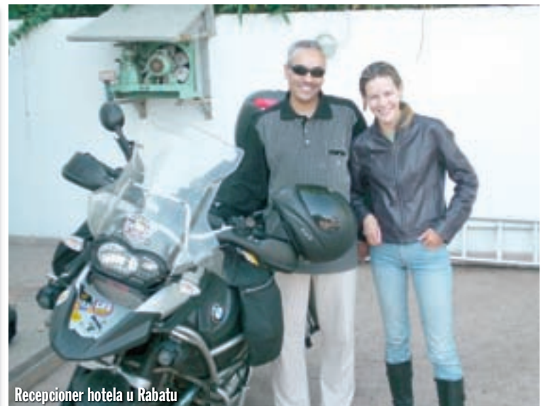
Recepconer hotela u Rabatu