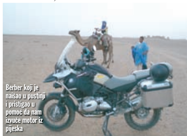
Berber koji je naišao u pustinji i pristigao u pomoć da nam izvuče motor iz pijeska

Rabata motorom, ali imamo nevolja već na početku, budući da nigdje ne mogu naći putovnicu. Nina je već sve "iznapadala" u hotelu da su nam je ukrali, no kriv sam ipak ja - zagubio sam je ispod kreveta. Na BMW-u ispred našeg hotela susrećemo jednog Talijana na modelu BMW GS 1200.