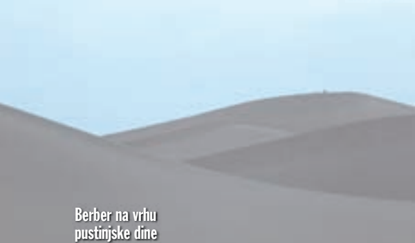
Berber na vrhu pustinjske dune