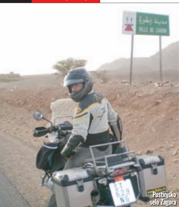
Pustinjsko selo Zagora Selo na putu za Marakes