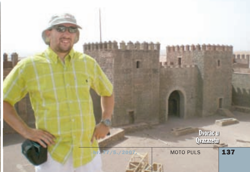
Dvorac u Qvazazetu