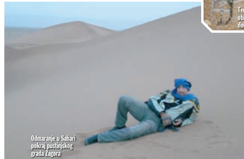
Odmaranje u Sahari pokraj pustinjskog grada Zagora