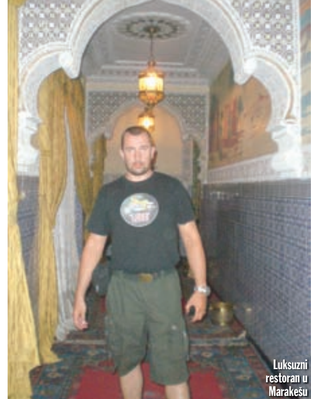
Luksuzni restoran u Marakešu