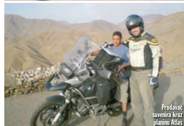
Prodavač suvenera kroz planinu Atlas