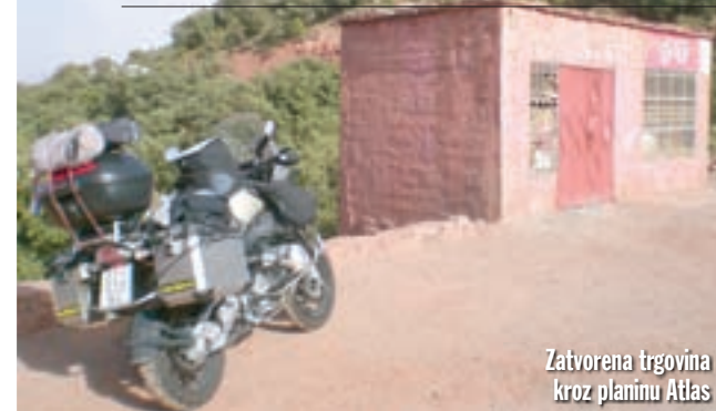
Zatvorena trgovina kroz planinu Atlas