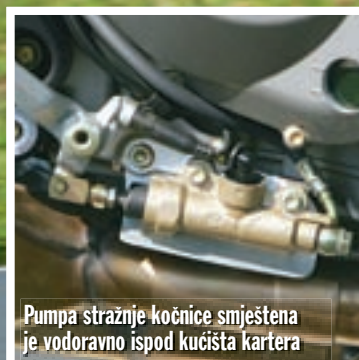
Pumpa stražnje kočnice smještena je vodoravno ispod kućišta kartera