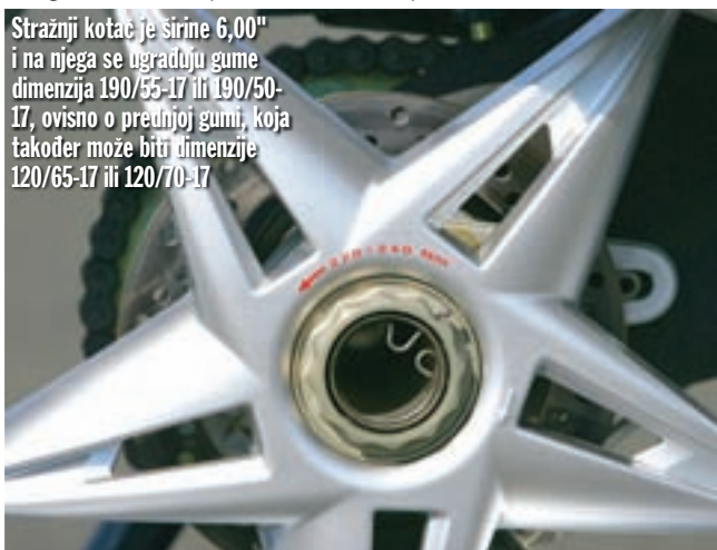
Stražnji kotac je širine 6,00" i na njega se ugrađuju gume dimenzija 190/55-17 ili 190/50-17, ovisno o prednjoj gumi, koja također može biti dimenzije 120/65-17 ili 120/70-17