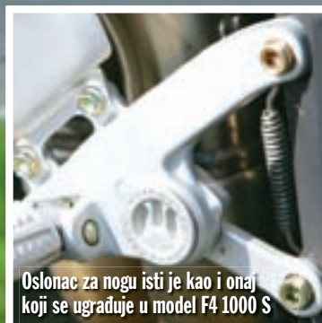
Oslonac za nogu isti je kao i onaj koji se ugrađuje u model F4 1000 S