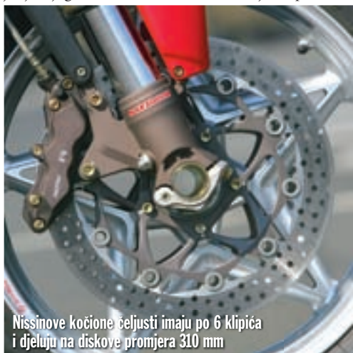
Nissinove kočione čeljusti imaju po 6 klipića i djeluju na diskove promjera 310 mm

Sad kad smo opisali sve što je ostalo isto kao i na modelu 750 S, spomenimo i one detalje po kojima se Brutale 910 S razlikuje od svog prethodnika. Osim boljih performansi koje su posljedica