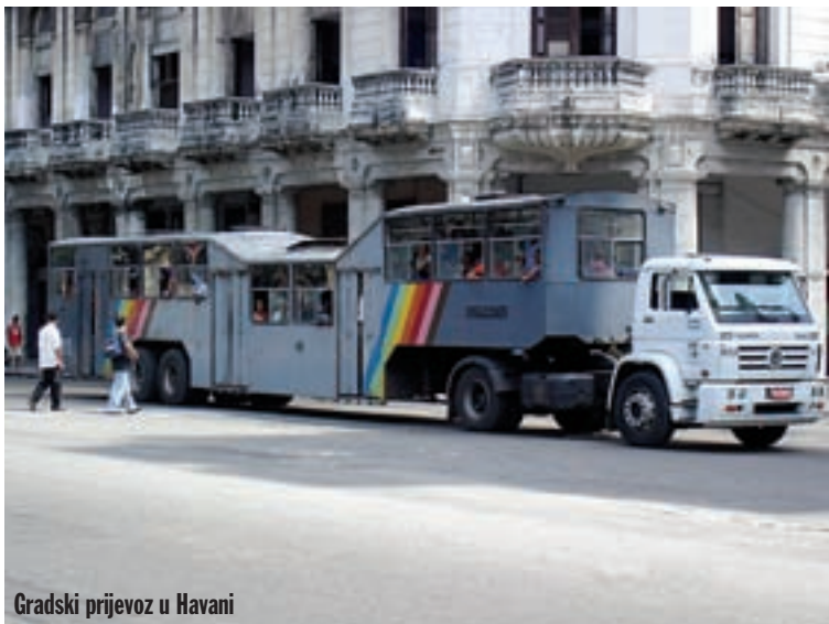
Gradski prijevoz u Havani

Autobus za Trinidad polazi u 12.00, a na određite stižemo za sat i pol vožnje. Unesco je 1988. proglasio ovaj grad zaštićenom svjetskom baštinom, a