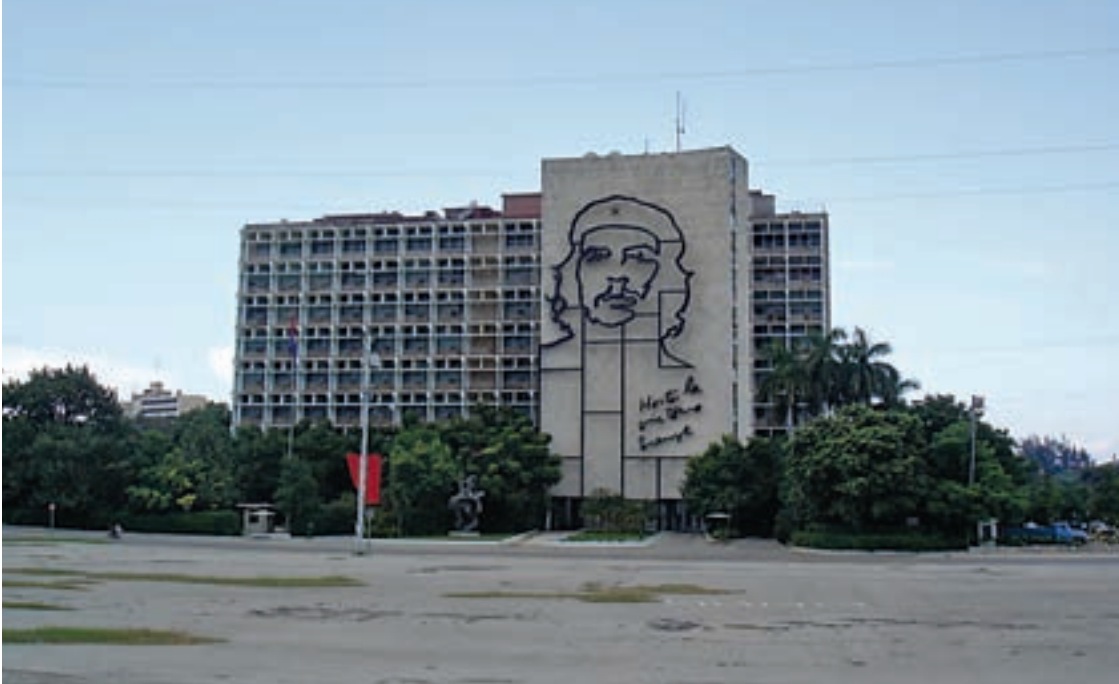
Plaza Revolucion - Havana

kle sam. Nude me kavom i voćem unatoč očitoj neimaštini u kojoj žive.