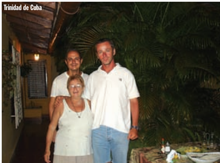
Trinidad de Cuba