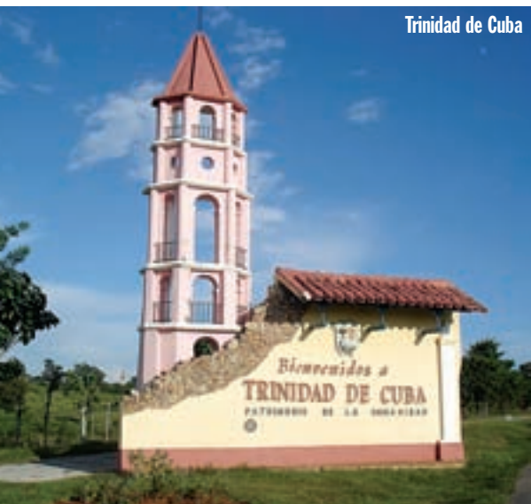
Trinidad de Cuba

Gazda smještaja u Matanzasu zove agenciju za iznajmljivanje skutera i pokušava rezervirati jedan. Nažalost nemam sreće, od 3 skutera 2 su već iznajmljena, a jedan je na popravku. Stoga se odlučujem