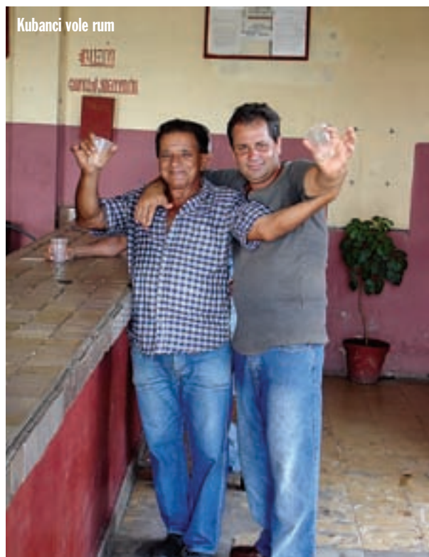
Kubanci vole rum

Izlazeći iz vrta razmišljam kako je apsurdno da u svome rodnome Zagrebu nisam u životu bio u botaničkom vrtu. Sram me bilo!