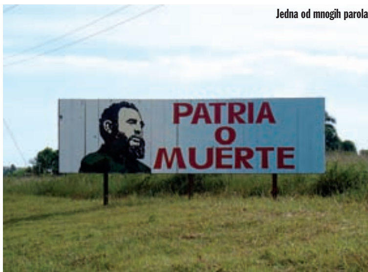
Jedna od mnogih parola