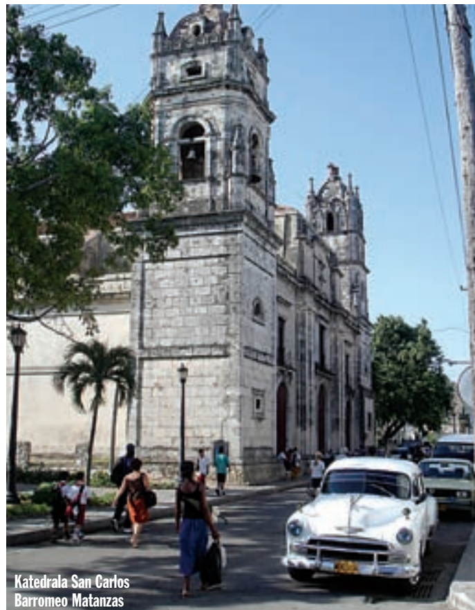
Katedrala San Carlos Barromeo Matanzas