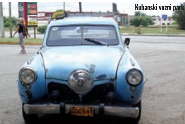
Kubanski vozni park

zaista dubokim poštovanjem. Svoju adresu u Havani Centro pronalazim nakon što sam obišao grad uzduž i poprijeko nekih 10 puta. Ostavljam motor na obližnjem čuvanom parkingu. Noć košta 1 CUC.