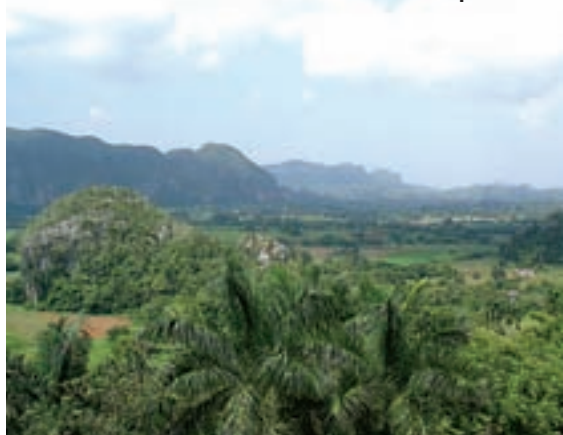
Nacionalni park Vinales

Prilikom plaćanja računa izmjenjujem par riječi sa simpatičnom tamnoputom konobaricom Mariel, koja mi ostavlja svoju adresu i izražava želju da se vidimo navečer u njenom selu Sanguily. Večeram u svojoj 'casi particular'. U glavi mi se mota misao je li pametno po mraku ići skuterom po relativno lošoj cesti u 50 km udaljeno mjesto da bih se našao sa Mariel.