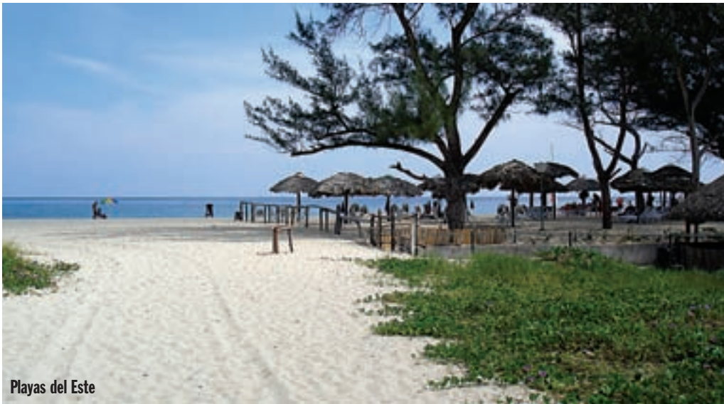
Playas del Este

Yeni. Moj španjolski je mršav, ali nakon nekoliko Cubi Libre bitno se popravlja.