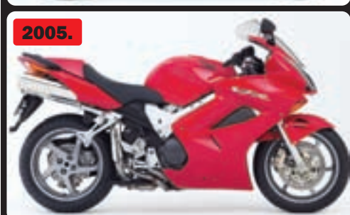
Od 1990. modele VFR 750/800 krasi jednoruka stražnja vilica izrađena u suradnji sa tvrtkom Showa