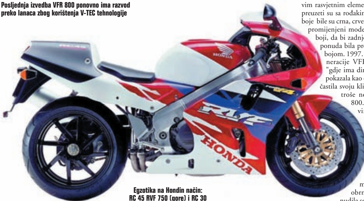
Egzotika na Hondin način: RC 45 RVF 750 (gore) i RC 30