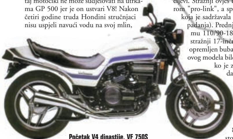
Početak V4 dinastije, VF 750S

Loša reputacija zbog kvarova, ali i jak udarac konkurencije 1985. godine, ponajviše Suzukija