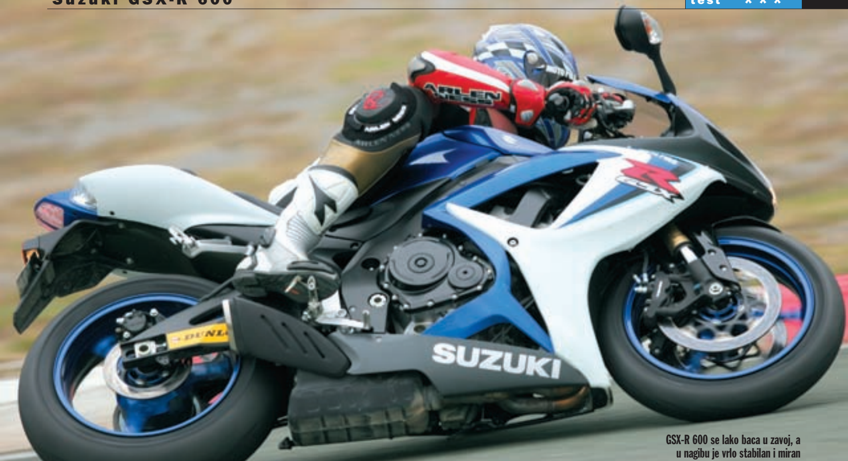
GSX-R 600 se lako baca u zavoj, a u nagibu je vrlo stabilan i miran

Za zaustavljanje se brinu dva prednja diska povećana za 10 mm, tako da sada imaju za tu klasu uobičajeni promjer od 310 mm, a radijalnu pumpu i radijalne kočione čeljusti je imao i stari model. Ono što stari model nije imao je protublokirajući uređaj na spojci, koji prilikom snažnih kočenja motorom omogućuje lamelama spojke da proklize u kritičnom trenutku i tako spriječe opasno blokiranje stražnjeg kotača.