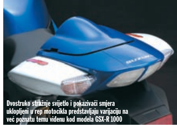
Dvostruko stražnje svijetlo i pokazivači smjera uklopljeni u rep motocikla predstavljaju varijaciju na već poznatu temu videnu kod modela GSX-R 1000