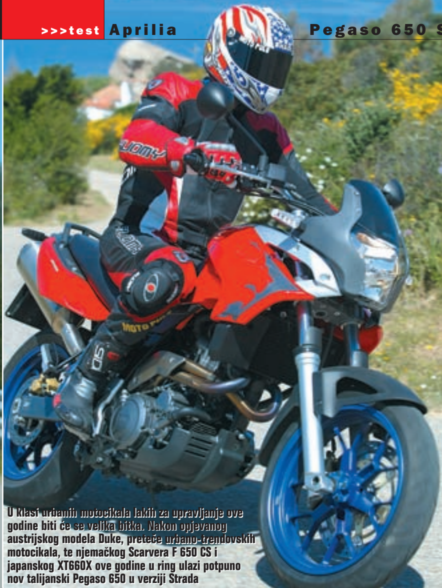
U klasi urđanih motocikala lakih za upravljanje ove godine biti će se velika bitka. Nakon opjevanog austrijskog modela Duke, preteče urđano-trendovskih motocikala, te njemačkog Scarvera F 650 CS i japanskog XT660X ove godine u ring ulazi potpuno nov talijanski Pegaso 650 u verziji Strada

Stražnji se pak Sachs amortizer može podešavati, i to u dvije opcije: preko opruge na predopterećenju i preko hidraulike na povratu. Njegov je hod također reduciran i sada iznosi 130 mm. Kočnice su klasične na Aprilijama Brembo serije Oro preuzete s modela Tuono s tim da Pegaso ima samo jedan disk naprijed. On je većeg promjera nego na standardnom Pegasu, odnosno sa 300 mm popeo se na 320 mm na koji djeluju čeljusti s 4 klipića. Straga je pak jedan disk istog promjera - 240 mm.