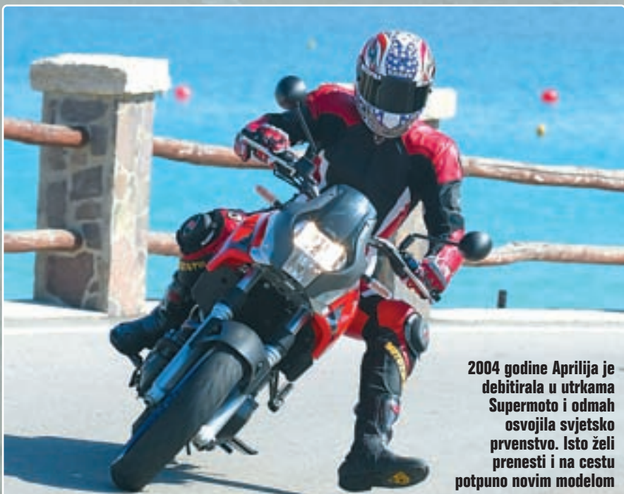
2004 godine Aprilija je debitirala u utrkama Supermoto i odmah osvojila svjetsko prvenstvo. Isto želi prenesti i na cestu potpuno novim modelom

Prednja kočnica je kao i kod većine konkurencije solidna i ne odstupa niti lijevo niti desno, ali moramo pohvaliti stražnju koju inače rijetko koristimo. Kako je položaj tijela vozača nešto uspravniji nego na Supermoto motociklima ili sportskim nakedima, ovdje svo težište pada na stražnji kotač te stražnje kočnica može pokazati svoje kvalitete. Dakle, ona je vrlo snažna a istovremeno se dobro dozira tako da kotač ne blokira, ukoliko vozač to ne želi.