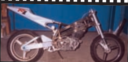
Razvojni put Fightera koji je saživio u "Šiletovoj" radionici i nekoliko etapa koje je ova prerada prošla do svog finalnog izdanja