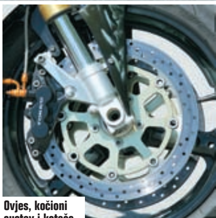
Ovjes, kočioni sustav i kotače donirao je GSX-R 750 SRAD

S obzirom na to da je okvir unikatne izra-