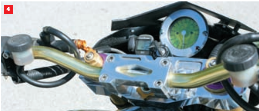
(1) Oslonci za noge djeluju vrlo efektno (2) Šiljati zubi "špice" ugrađuju se samo u izložbene svrhe (3) Osim atraktivnog izgleda cjevasti okvir CrNiMoTi 4404 odlikuju velika čvrstoća i mala težina (4) Upravljački sklop je također ručne izrade (5) Unikatni "konjići" (6) Masivni mostovi upravljača vrlo su efektni (7) Amortizer upravljača od Yamaha R1