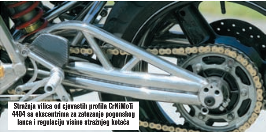
Stražnja vilica od cjevastih profila CrNiMoTi 4404 sa ekscentrima za zatezanje pogonskog lanca i regulaciju visine stražnjeg kotača