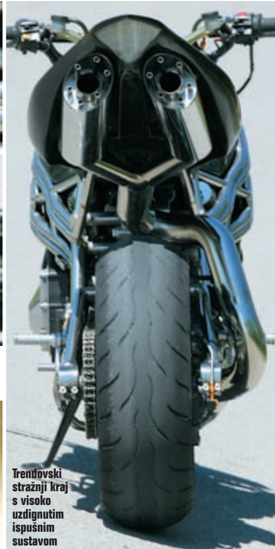
Trendovski stražnji kraj s visoko uzdignutim ispušnim sustavom

nje, rastavljanje i dorada, završna obrada i na kraju testiranje i kontrola, a sve to oduzima jako, jako puno vremena.