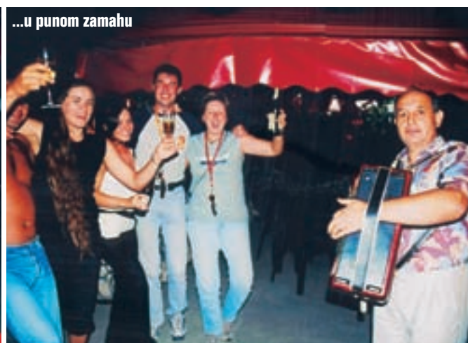
...u punom zamahu