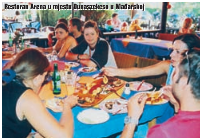
Restoran Arena u mjestu Dunaszekcso u Mađarskoj