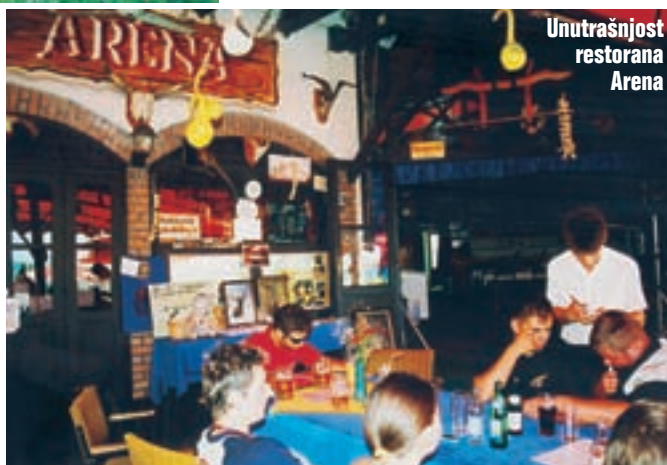
Unutrašnjost restorana Arena