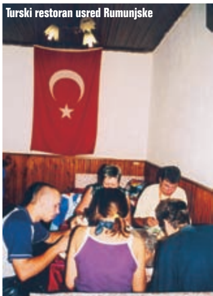
Turski restoran usred Rumunjske