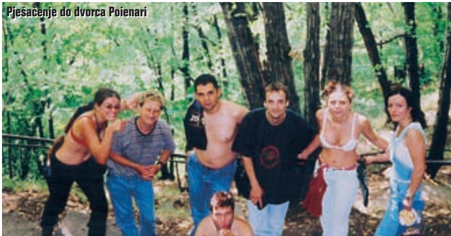
Pješačenje do dvorca Poienari