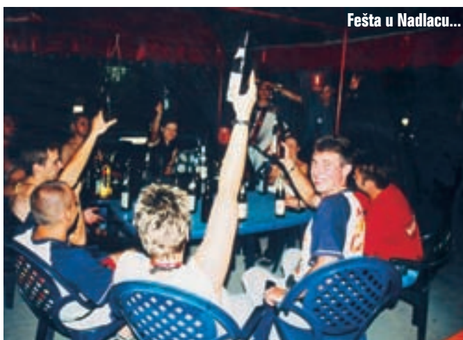
Fešta u Nadlacu...

Budimo se relativno rano, svi odreda orni za daljnji put. Doručak, mazanje lanaca i točenje goriva na obližnjoj benzinskoj crpki, pa možemo dalje. Iznenađujuće dobra, očito nova cesta, vodi nas dolinom rijeke Mures obilaznicom Arada, kroz termalno lječilište i izvore mineralne vode Lipovu, kroz Devu i Simeriu do Sibiu, velikog, ružnog indu-