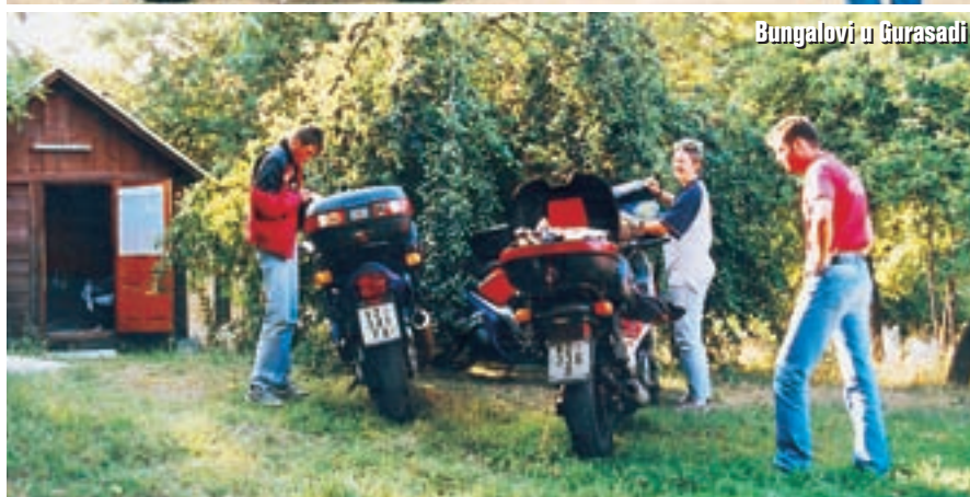
Bungalovi u Gurasadi

japanskim motociklima koji su nam dolazili u susret, a mislimo da su bili Nijemci. Na vrhu prijevoja sve je puno automobila. Iako je dan sunčan, gore je gusta magla. Ovdje se mogu kupiti suveniri, a tu je i jedini ugostiteljski objekt na cijelih 100 km puta! Ali, na naše čuđenje nigdje ne piše koliko je prijevoj visok! To nismo uspjeli saznati niti od domaćih ljudi. S obzirom da su do nas bile planine visoke preko 2.500 metara, a mi smo bili samo malo niže, pretpostavljam da smo na visini od oko 2.300 metara. Ovdje pored vrha je izvor rijeke Arefu koja nas je toliko kilometara vjerno pratila.